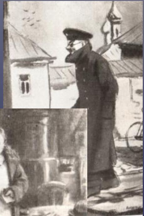
А.П.Чехов «Человек в футляре»