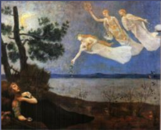
Полк до Шванн (1824–1890). Губка

За реальным миром скрываются миры Божественной сущности, любви, красоты. В реальности существуют лишь символы, намёки на иные миры.