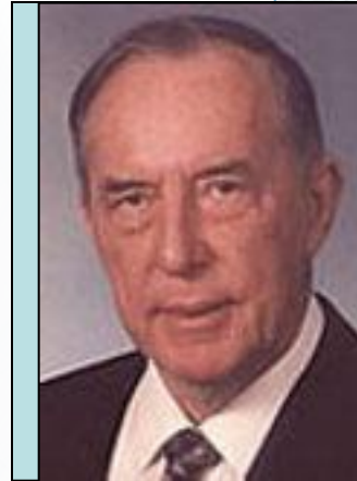
Алекс Осборн – автор метода

Метод появился в США в конце 30-х гг. Окончательно оформился и стал известен широкому кругу с выходом в 1953 г. книги А. Осборна "Управляемое воображение", в которой были раскрыты принципы и процедуры творческого мышления.