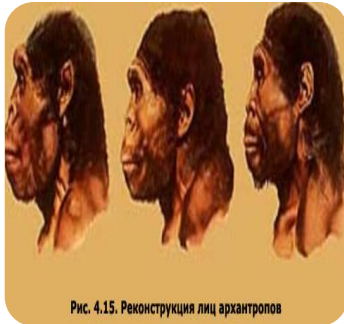
Рис. 4.15. Реконструкция лиц архантропов

Появляются древнейшие люди архантропы: питекантропы, синантропы, гейдельбергский человек