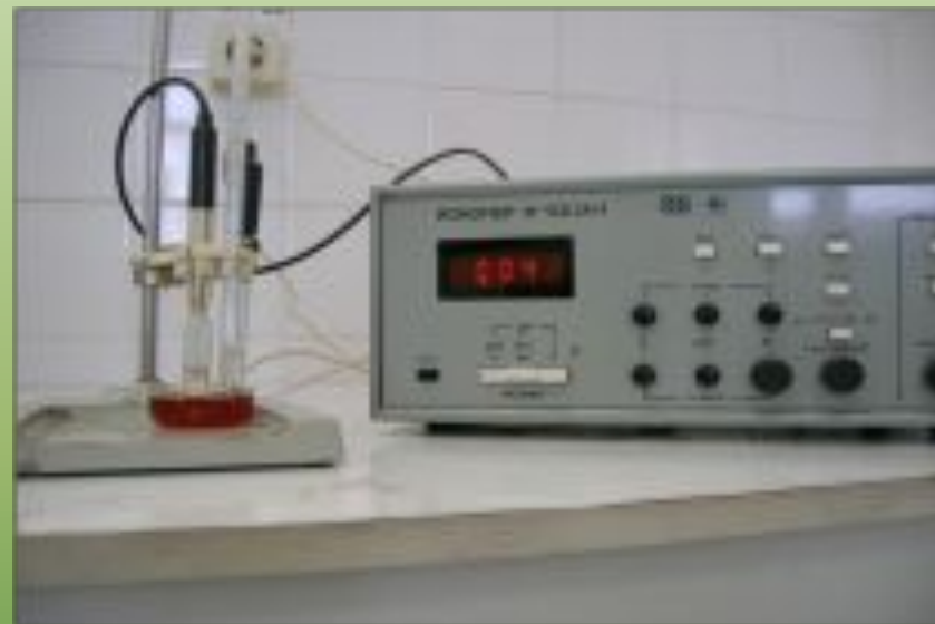
Результаты настоя лишайников фоновой площадки