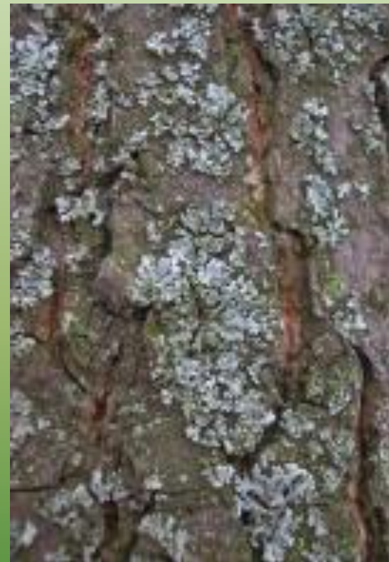
Пармелия бороздчатая P. sulcata Tayl.