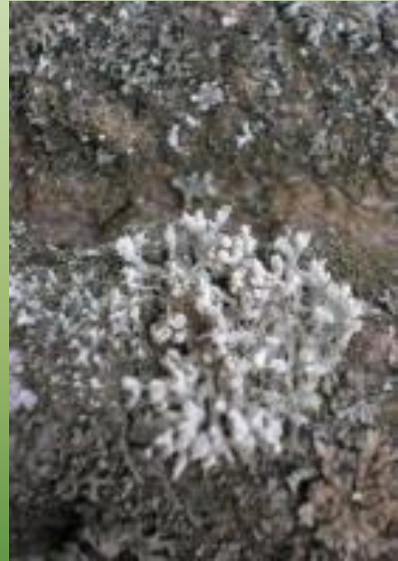
Фисция щетинистая Ph. hispida (Schreb)