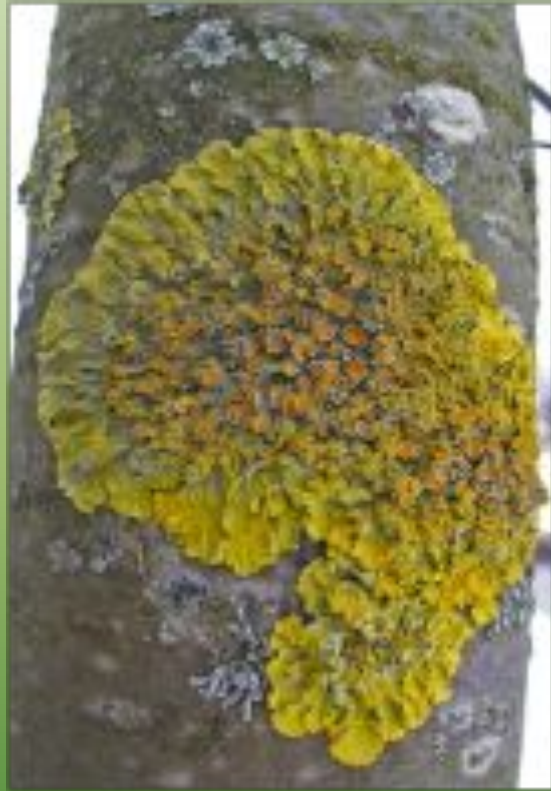
Гаспариния обманчивая G. decipiens ( Arn. )