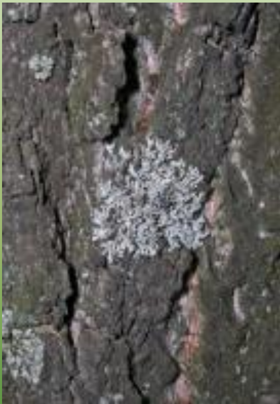
Фисция аиполия Ph. aipolia (Ehrh.) Hampe