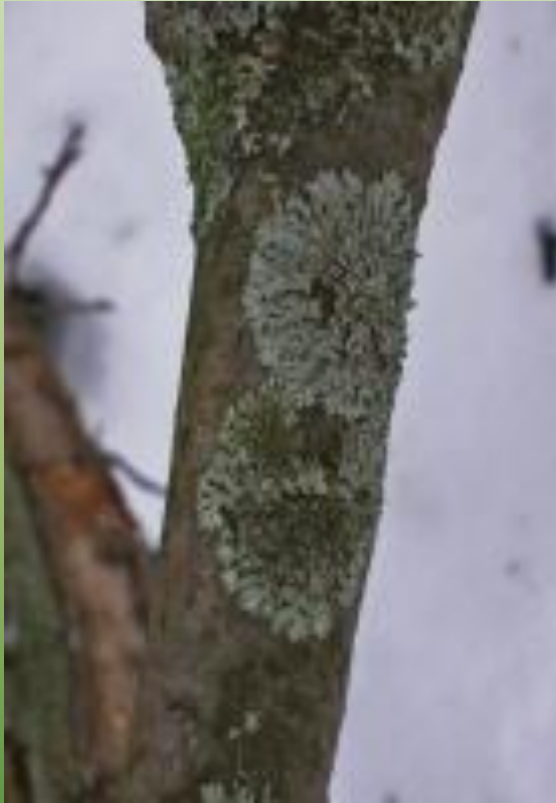
Фисция аиполия Ph. aipolia (Ehrh.) Натре