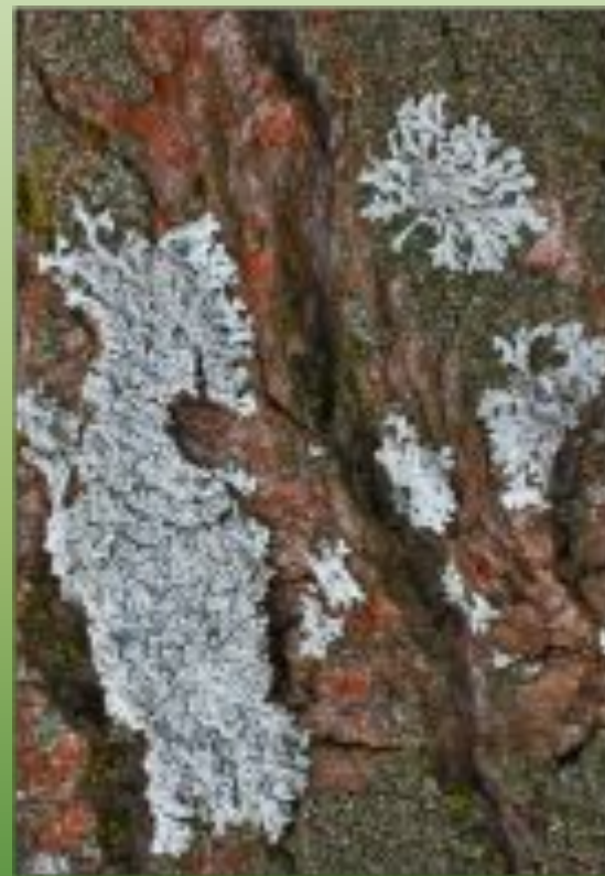
Фисция припудренная Ph. pulverulenta (Schreb)