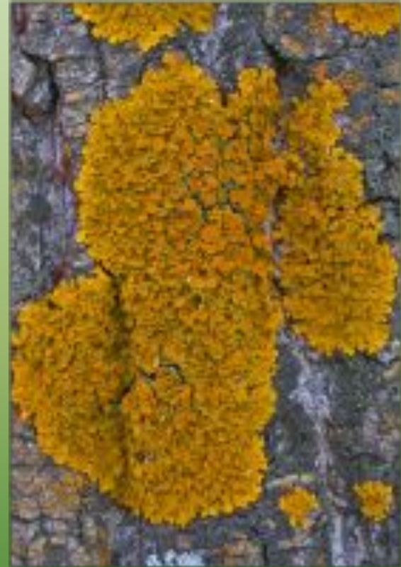
Колоплака оранжевая C. aurantiaca