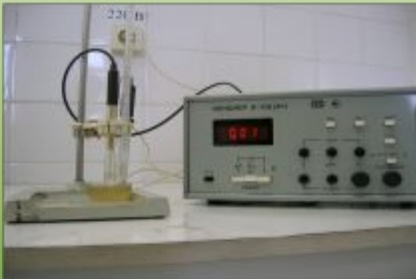
Результаты настоя лишайников сквера