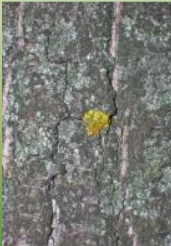
Ксантория постенная X. parietina (L.) Belt