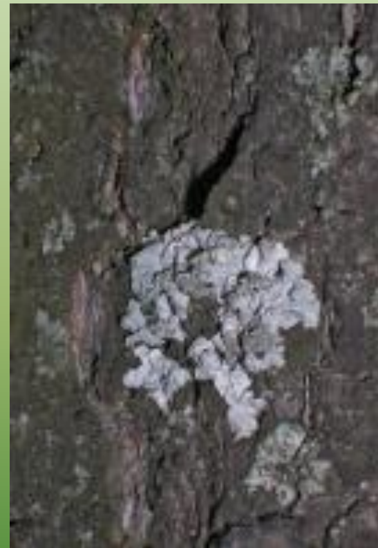
Пармелия козлиная P. caperata (L.) Ach