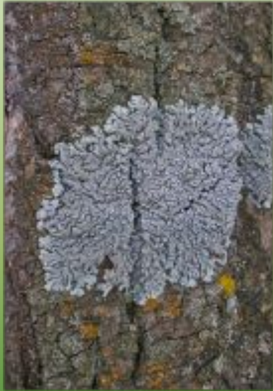
Анаптихия красивая A. speciosa ( Wulf. )