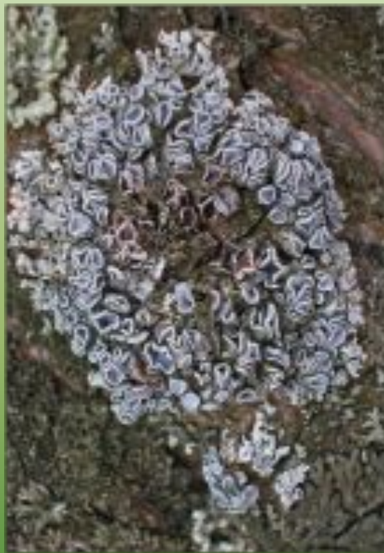
Фисция звездчатая Ph. stellaris (L.) Nyl.