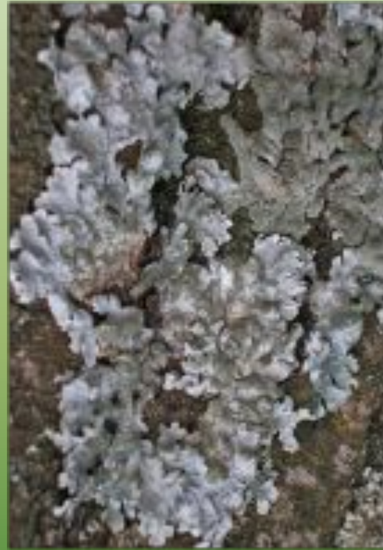
Пармелия скальная P. saxatilis ( L. )