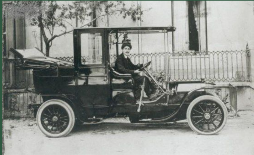
Автомобильная фирма «Фиат»