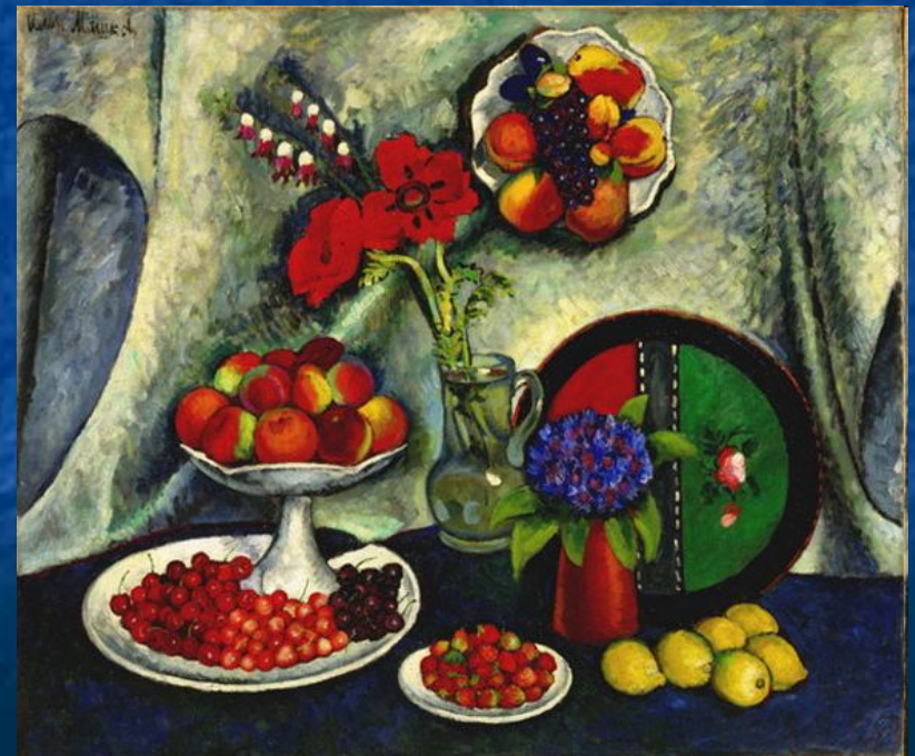
И. Машков «Натюрморт с маками и васильками»