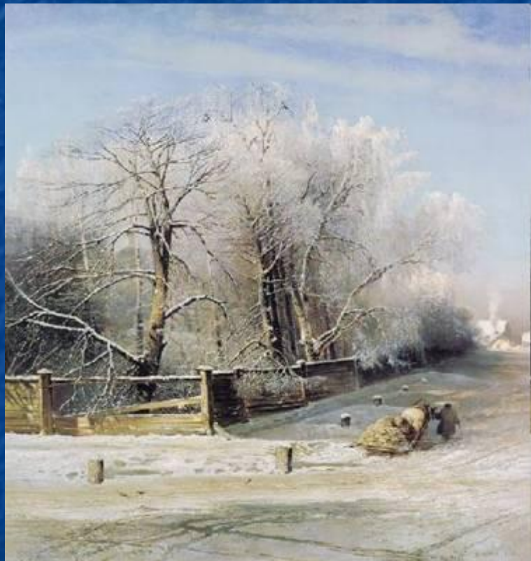
Алексей Саврасов. «Зимний пейзаж».