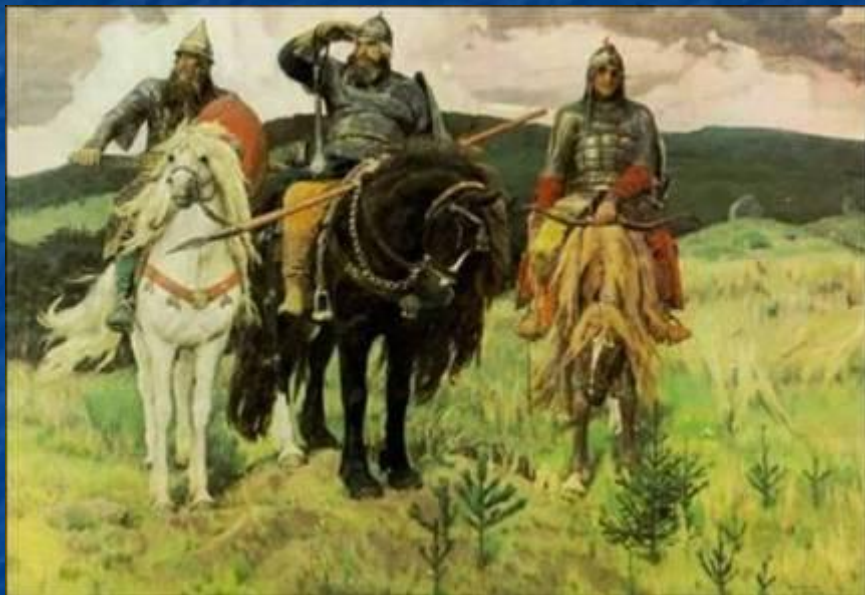
В. М. Васнецов. «Богатыри»