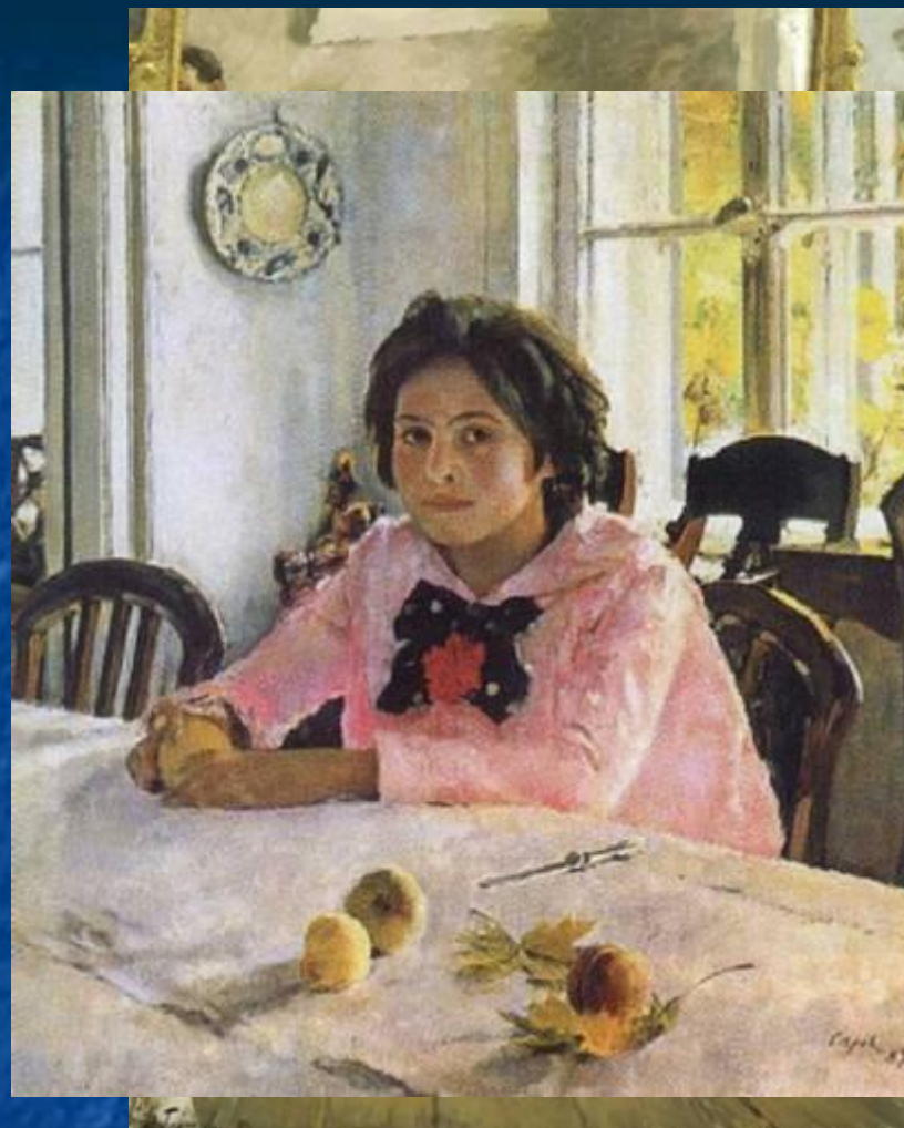
В. Серов « Девочка с персиками » Д. Герасимов «Портрет балерины О.В. Лепешинской»