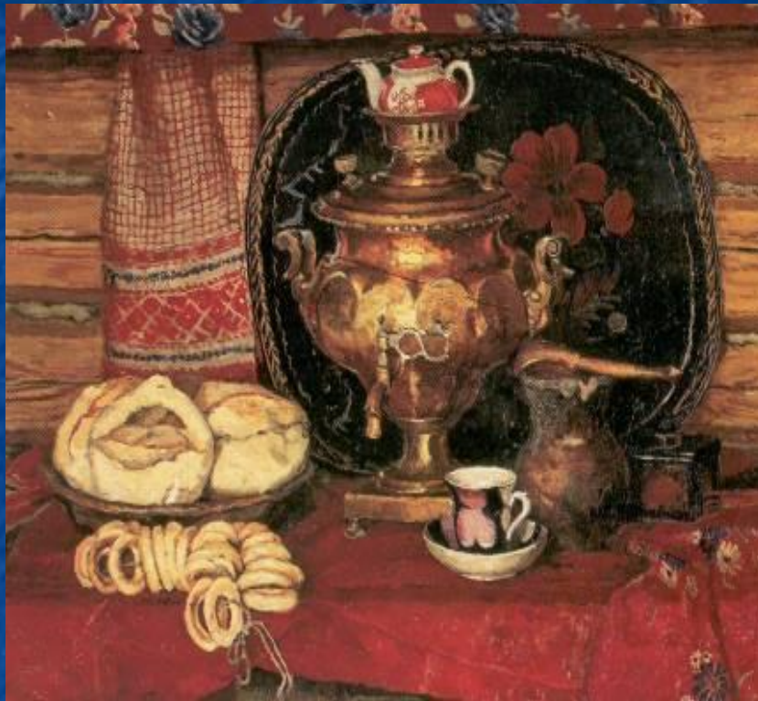
Д. Соболева. «Натюрморт с самоваром»