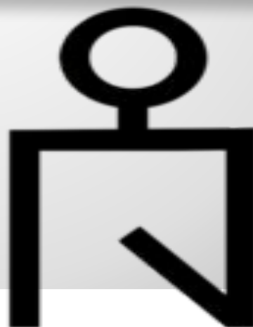
Меңгу – Темір таңбасы.