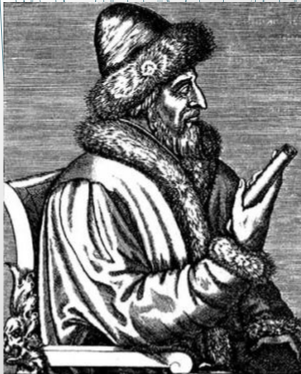
Василий III Государь всея Руси