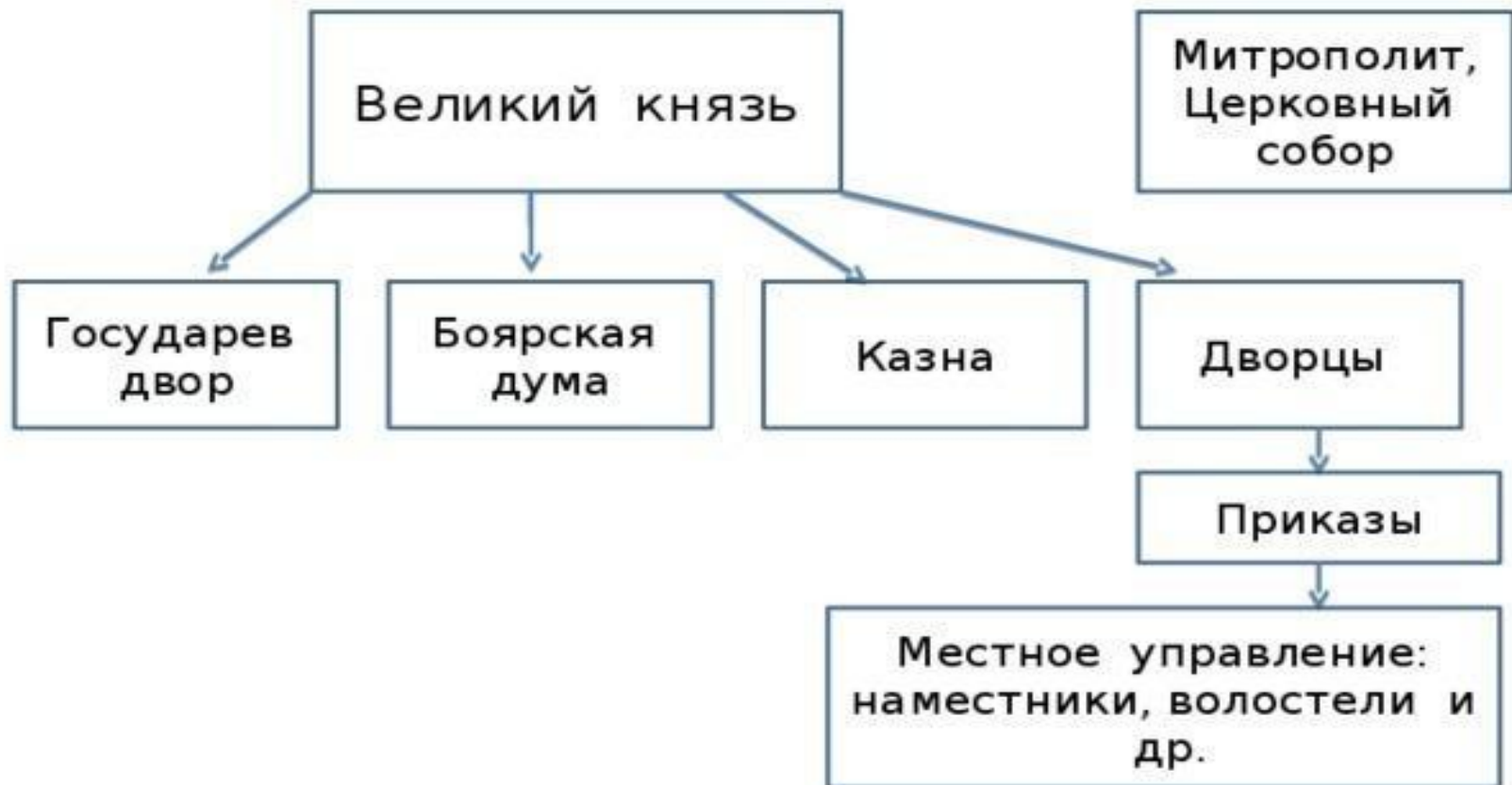
Схема управления Российским государством в первой трети XVI века