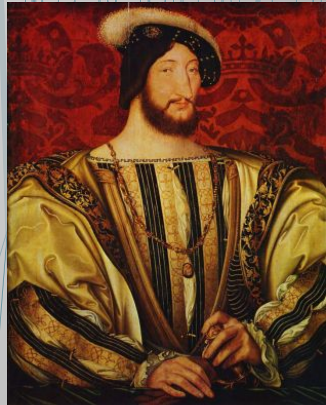
Франциск I Король Франции