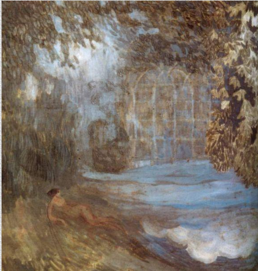
П.С. Уткин. Сон. Декоративное панно., 1900 г. Русский музей.