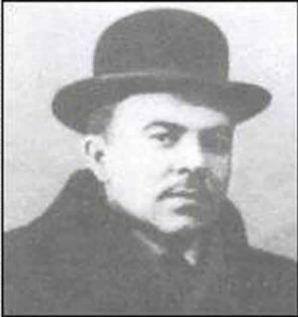
КУЗНЕЦОВ Павел Варфоломеевич 17 ноября 1878 (Саратов) — 22 февраля 1968 (Москва) Живописец, график, сценограф

Это была первая попытка консолидации творческих сил художников, составивших направление символизма в русском искусстве.