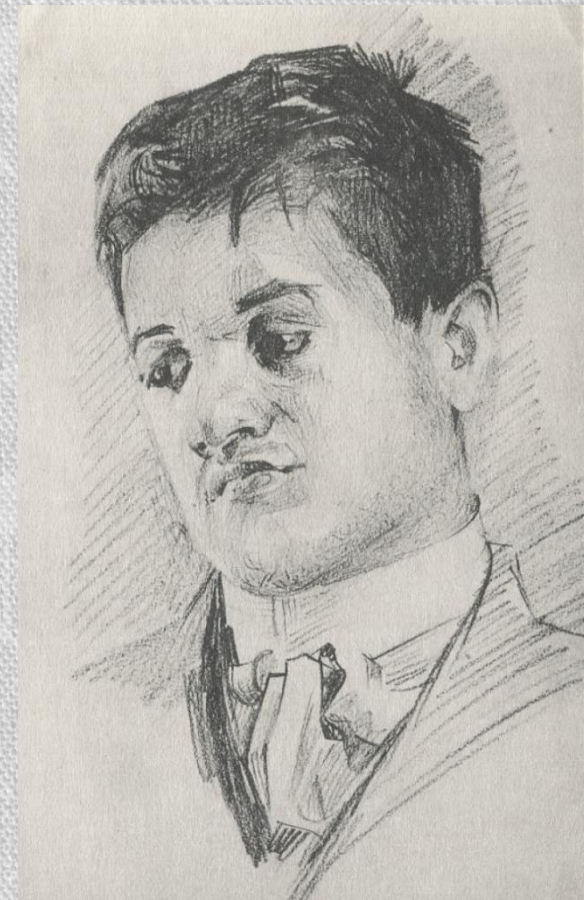
М.А. Врубель. Портрет П. П. Бромирского. 1904 г. Собрание Терещенко.