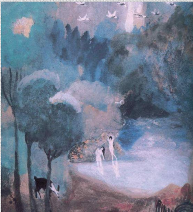
М.С. Сарьян. Озеро фей, 1905 г. ГТГ.