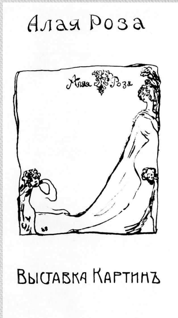
Обложка каталога, оформленного С. Ю. Судейкиным