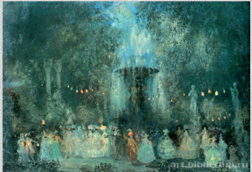
Н.Н. Сапунов. Маскарад. 1907. ГТГ