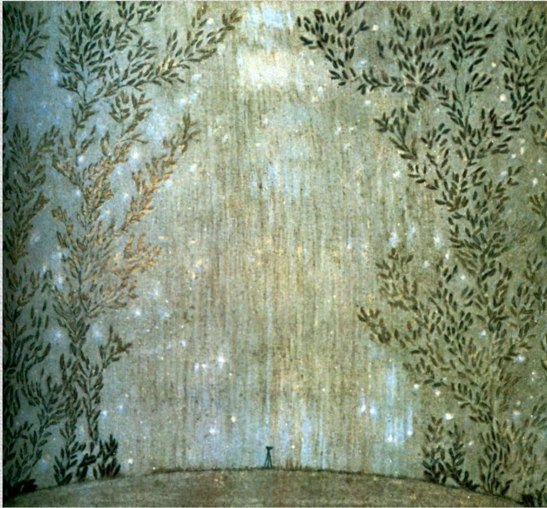
П.С. Уткин. Торжество в небе. 1905.