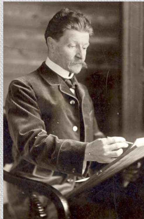
ВРУБЕЛЬ Михаил Александрович 5 марта 1856 (Омск) — 1 апреля 1910 (Санкт-Петербург)

Живописец, график, сценограф, художник ДПИ, скульптор.