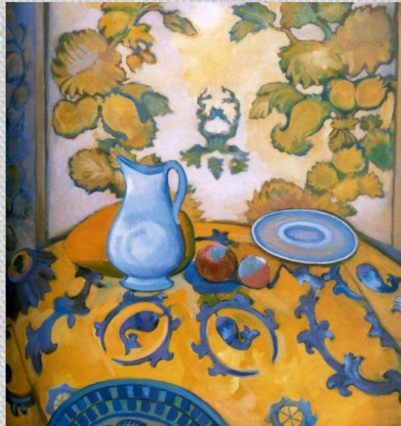
П.В.Кузнецов, Натюрморт с сюзане. 1913 г. ГТГ.