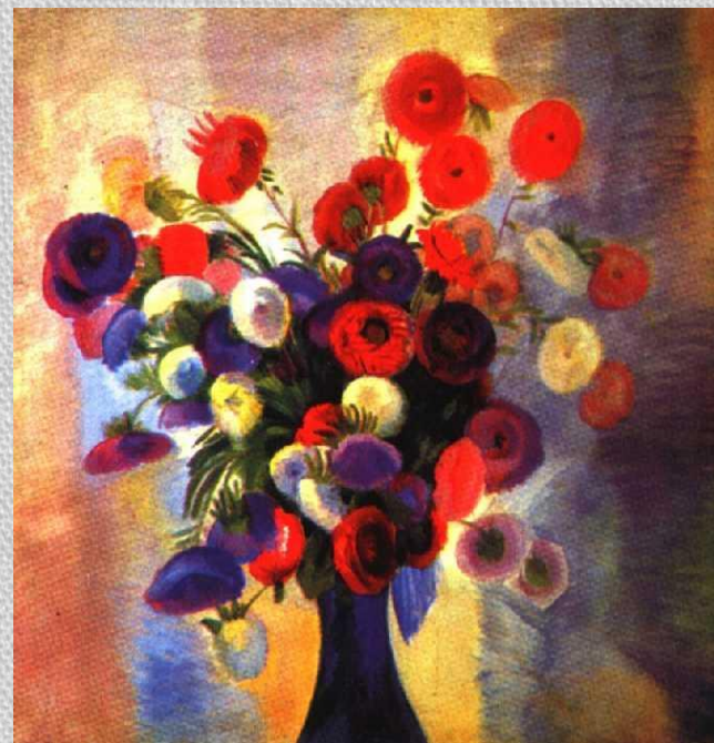
П. В. Кузнецов. Натюрморт «Бухара». 1903 г.