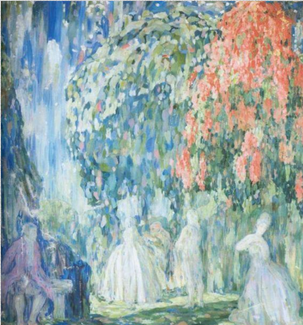
В.Д. Милиоти. Вечерний праздник., 1900 г. Русский музей.