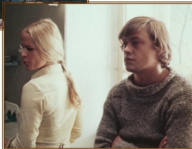
К/Ф «Старший сын» режиссёра Виталия Мельникова, в ролях: Евгений Леонов — Сарафанов, Николай Караченцов — Бусыгин, Наталья Егорова — Нина Сарафанова, Владимир Изотов — Васенька Сарафанов, Светлана Крючкова — Наталья, Михаил Боярский — Сильва.