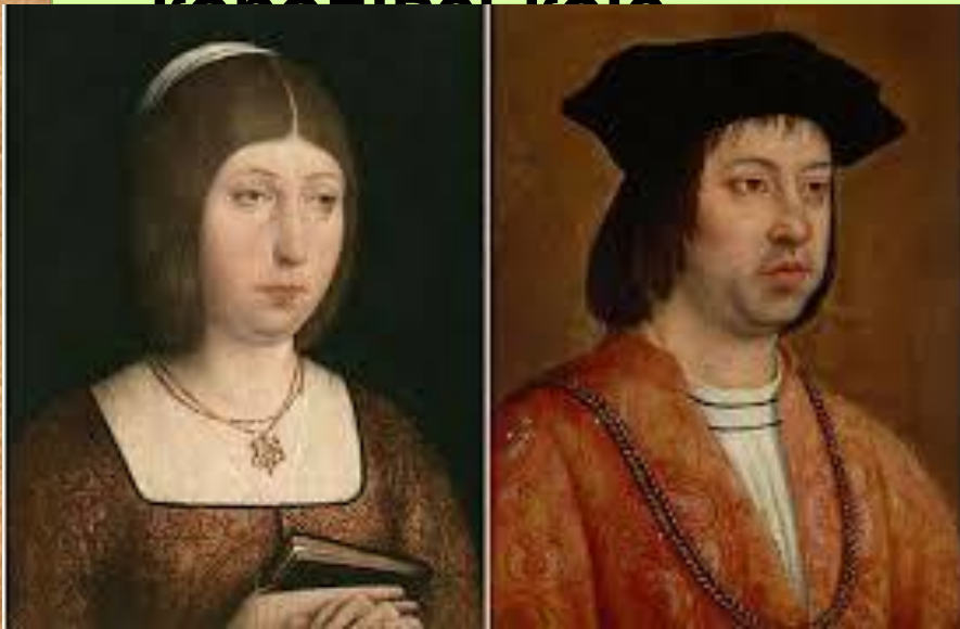
Ізабелла Кастильська та Фердинанд