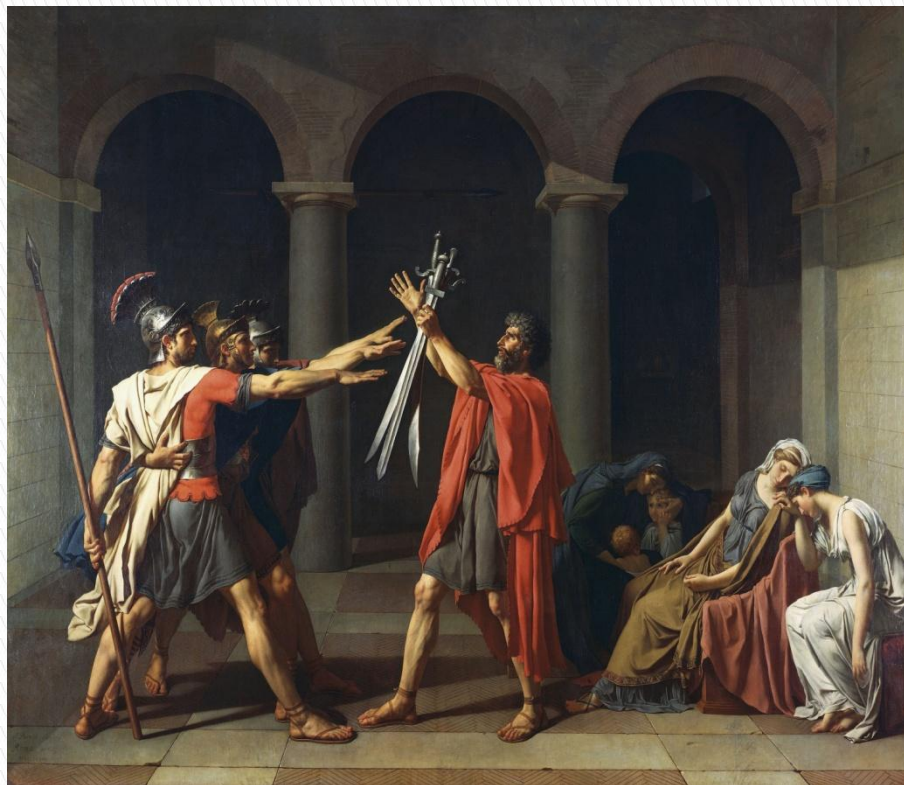
Жак-Луи Давид - Клятва Горациев