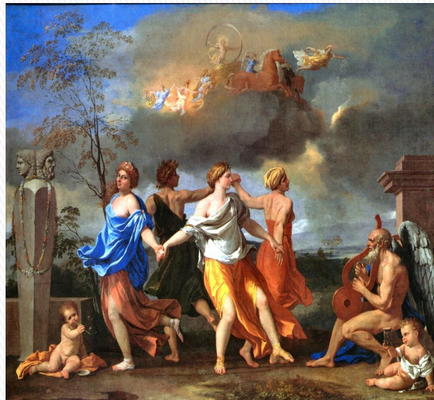
Никола Пуссен - Танец под музыку времени