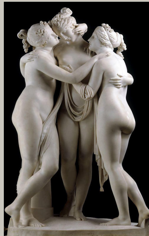
А. Канов «Три грации».