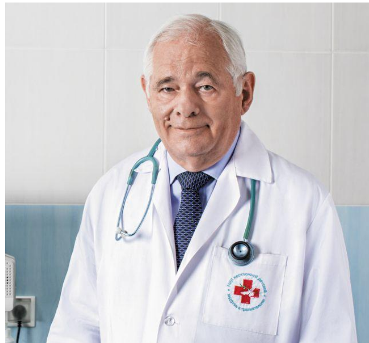
Леонид Михайлович РОШАЛЬ - детский доктор Мира