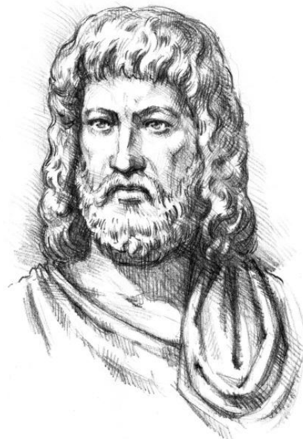
Асклепиад (др.-греч. Ἀσκληπιάδης)

Профессия врача - одна из наиболее древних профессий. В истории навсегда останутся имена первых выдающихся врачей древности Гиппократ, Асклепида, чьи знания и искусство лечить людей не только спасли многие жизни, но и обусловили развитие медицины.