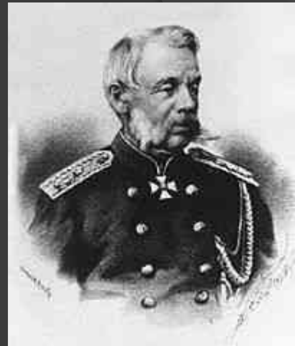
Воєнний міністр Д. А. Мілютін