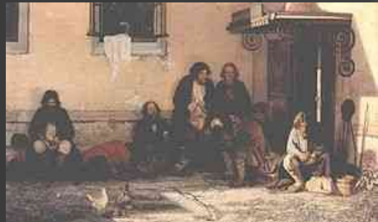
Г.Мясоедов Земство обедаєт

ЗЕМСТВА — загальностанові, виборні органи місцевого самоврядування з розпорядчими й виконавчими повноваженнями та функціями.