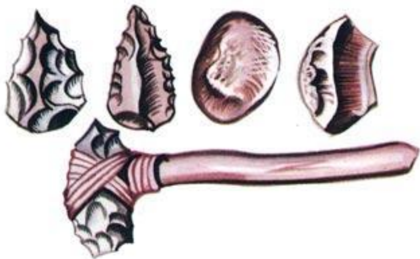
Каменные орудия первобытного человека.