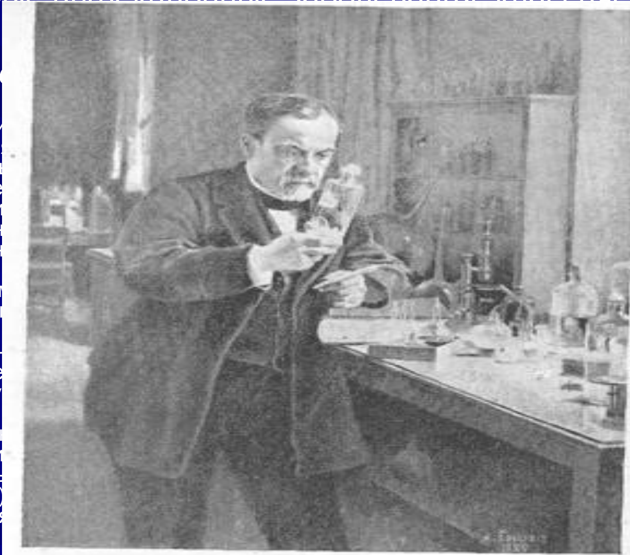
Л. Пастер в своей лаборатории. Картина Эдльфельда.

В области и описани отдельн совреме времени поражен возможн стертые долго в действи Боткину возврат впервые на другу котором второй, внимани он перв клинике) значени