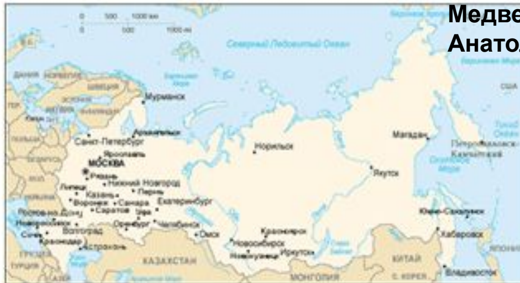
Медведев Дмитрий Анатольевич.