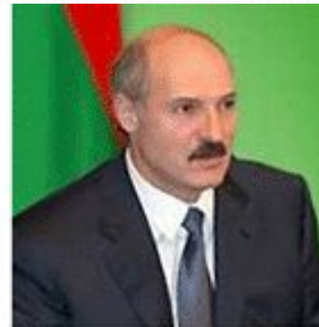
Лукашенко Александр Григорьевич