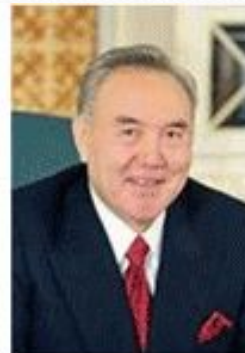
Назарбаев Нурсултан Абишевич