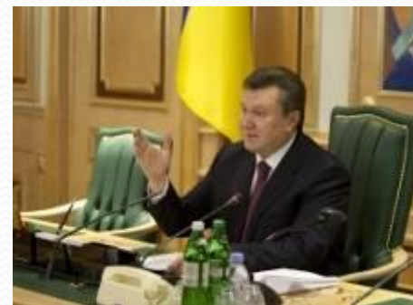
Виктор Фёдорович Янукович