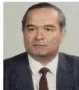
Президент Республики Узбекистан