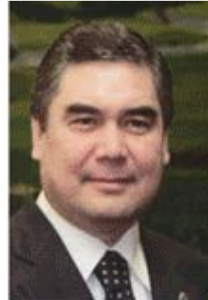
Бердымухамедов Гурбангулы Мяликгулыевич.