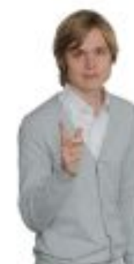
Павел Тарасенко Подписаться