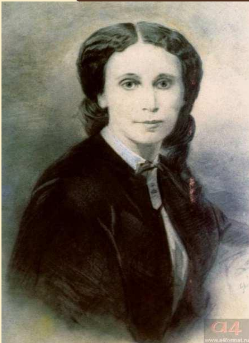
Фото начала 1860-х

«Денисьевский» цикл - это собрание стихотворений Ф.И. Тютчева, в которых говорится о его любви к Елене Денисьевой. Отношения поэта с Денисьевой были более чем драматичными, однако продолжались в течение четырнадцати лет. Общество с трудом мирилось с их связью: во-первых, Тютчев был женат, во-вторых, возлюбленная годилась ему в дочери. Но, несмотря ни на что, отношения продолжались