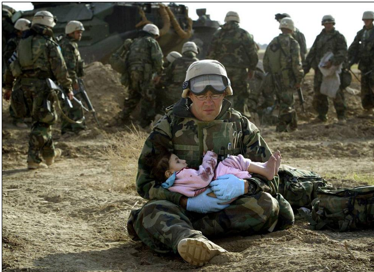
ВРАЧ МОРСКОЙ ПЕХОТЫ ДЕРЖИТ НА РУКАХ ИРАКСКУЮ ДЕВОЧКУ В ЦЕНТРАЛЬНОМ ИРАКЕ 29 МАРТА 2003 ГОДА. КОГДА МЕСТНЫЕ СОЛДАТЫ НАЧАЛИ ВЫТЕСНЯТЬ ГРАЖДАНСКИХ ЖИТЕЛЕЙ В СТОРОНУ ПОЗИЦИЙ МОРСКИХ ПЕХОТИНЦЕВ, ПЕРЕКРЕСТНЫЙ ОГОНЬ НА ЛИНИИ ФРОНТА РАЗБИЛ ИРАКСКУЮ СЕМЬЮ.