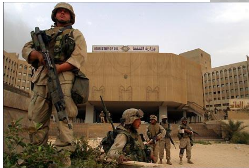
Солдаты США в центре Багдада

К 10 апреля общие американские потери составляли 108 убитых. Собственно во время штурма Багдада было потеряно несколько десятков убитыми и ранеными, сбит штурмовик А-10 (пилот спасся). Подбиты несколько танков и БМП. Во время штурма и предшествующей авиационной подготовки Багдад пострадал несильно, поскольку использовалось почти исключительно высокоточное оружие. Население Багдада во время авиаударов не пряталось в убежища, поскольку на опыте убедилось, что американцы воздерживаются от огульных огневых ударов по площадям.