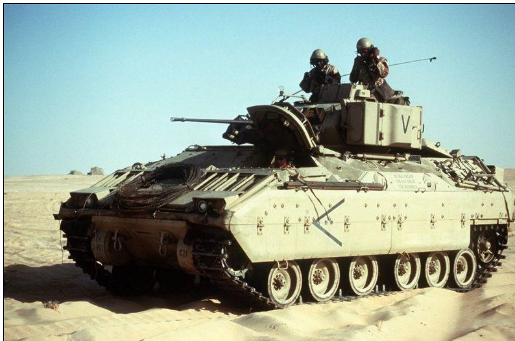
БМП М2 "Бредли"