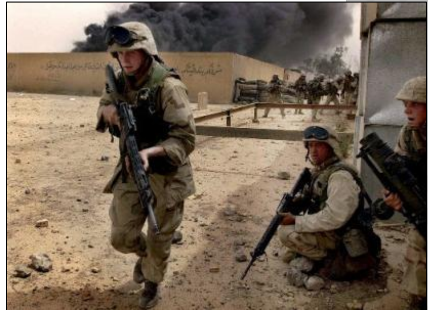
Бои в Басре