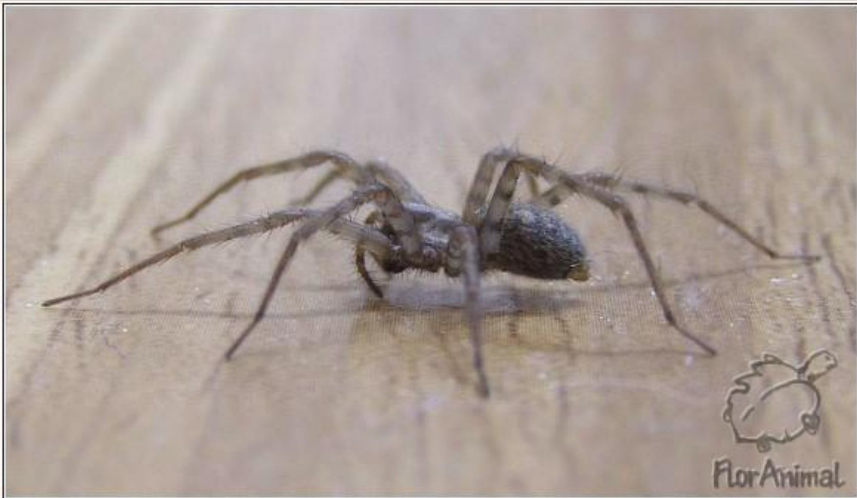
Паук домовый ( Tegenaria domestica )