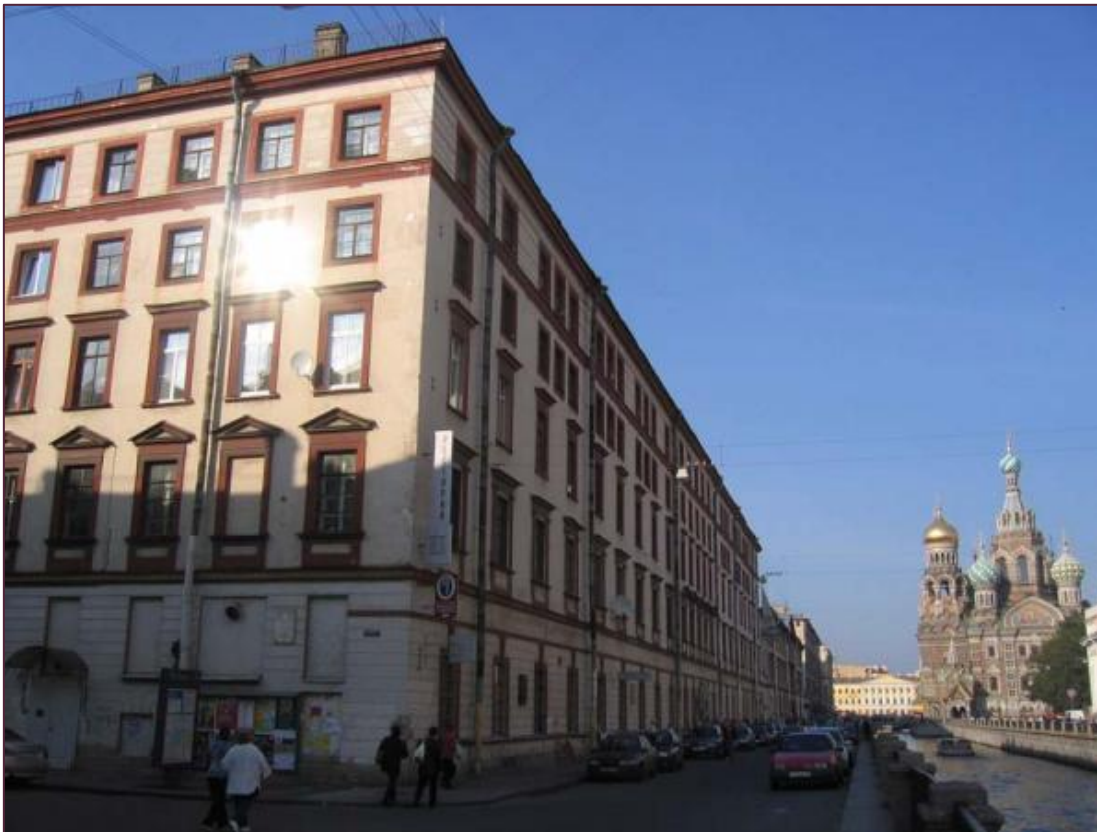
Государственный литературно-мемориальный музей им. М.М. Зощенко в Санкт-Петербурге

Уникальность музея М. Зощенко состоит в том, что в кабинете все вещи подлинные, обстановка, в которой проходили дни писателя с января 1955 по июль 1958 года, воссоздана с детальной точностью.