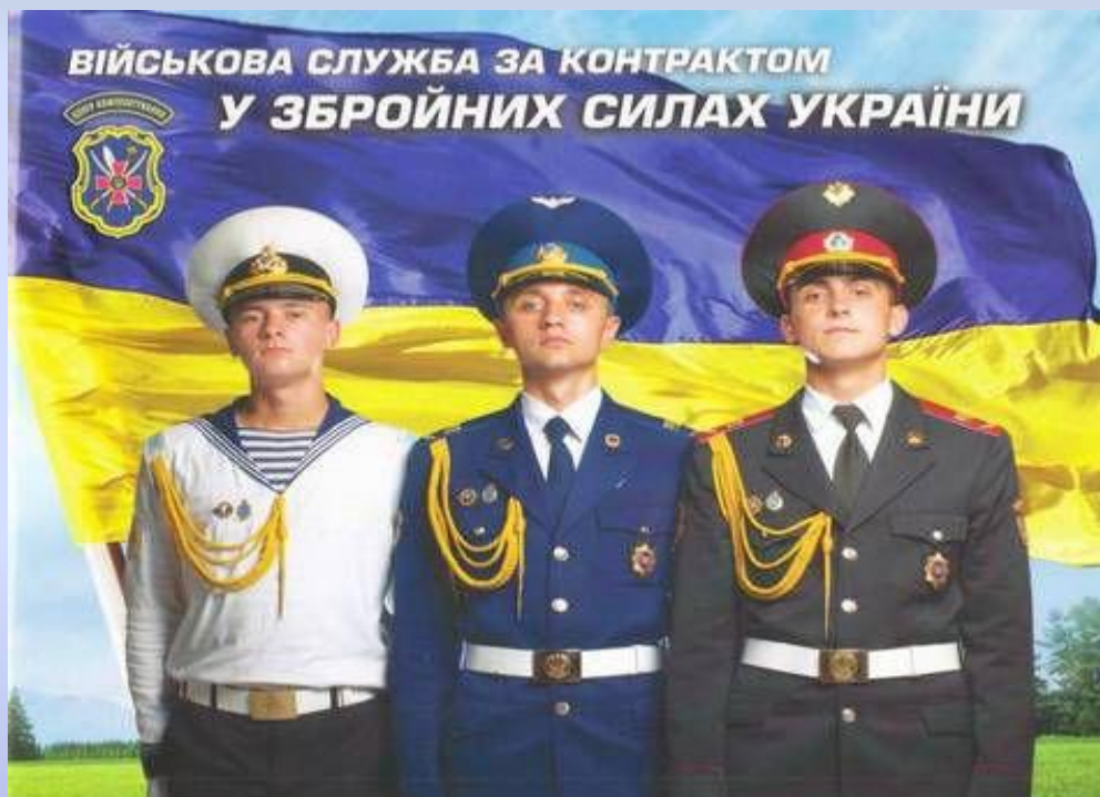
Бұқаралық жарнама; Украина.

Әскери маркетинг – түрлі әскери құрылымдарды таныту, жастарды әскерге шақыру секілді қызметтермен айналысады.