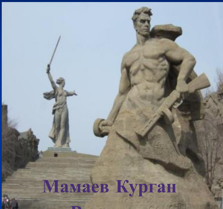
Мамаев Курган в Волгограде Монумент- «Родина- мать зовет»