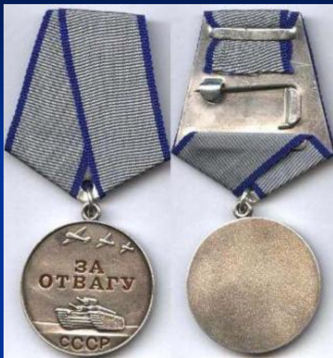
Медаль за отвагу

За героизм и подвиги на войне, солдаты награждались орденами и медалями.