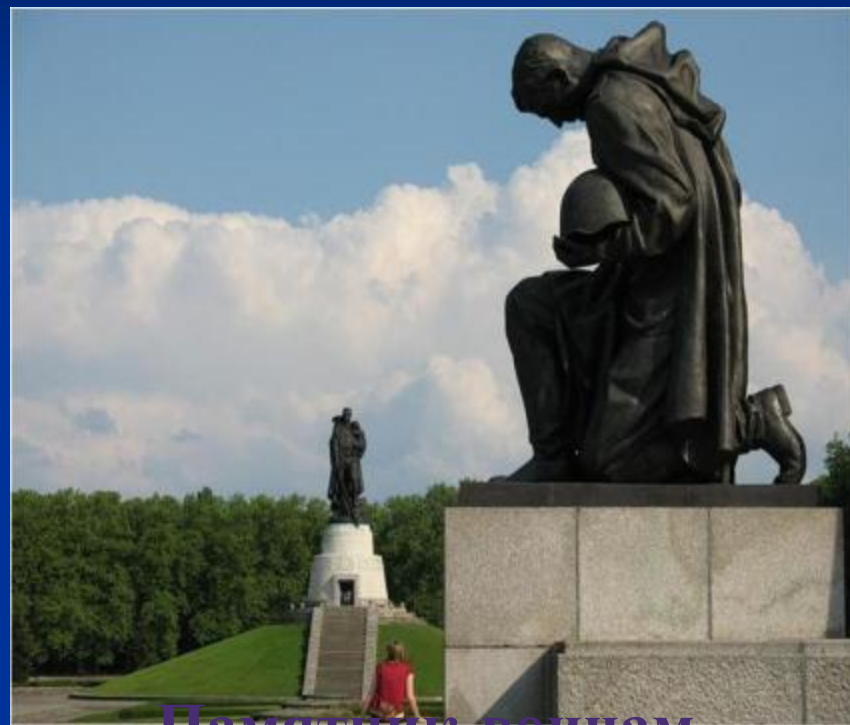
Памятник воинам Советской Армии павшим в боях с фашизмом.