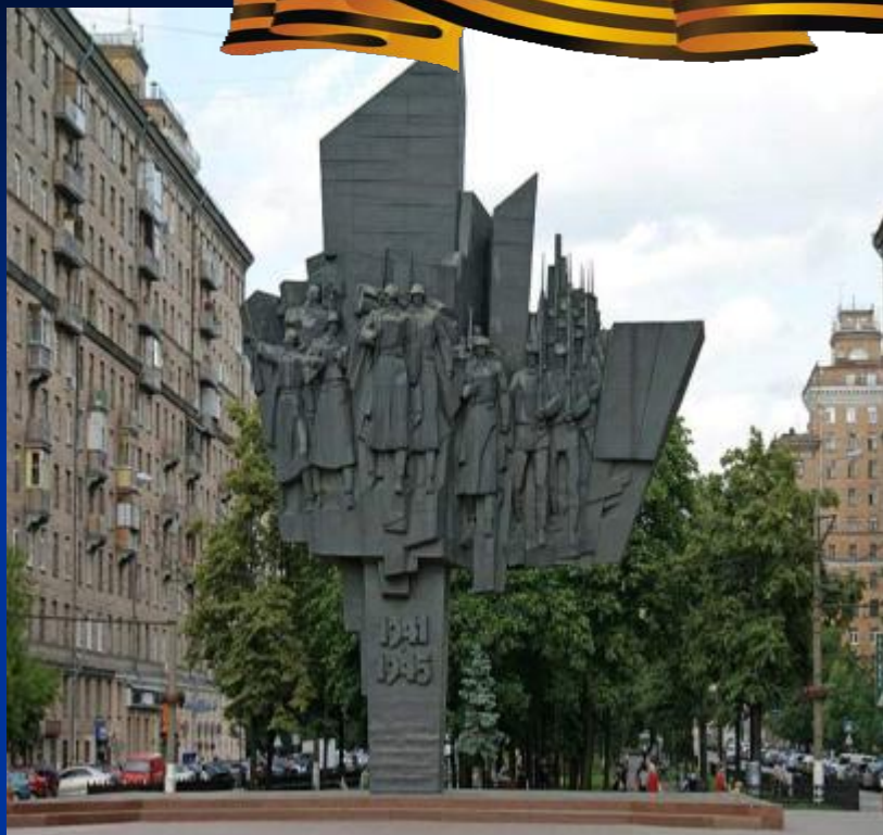
Монумент- «Защитники Москвы»