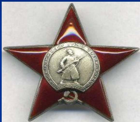
Орден красной звезды