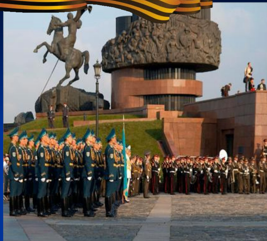
Поклонная гора в Москве