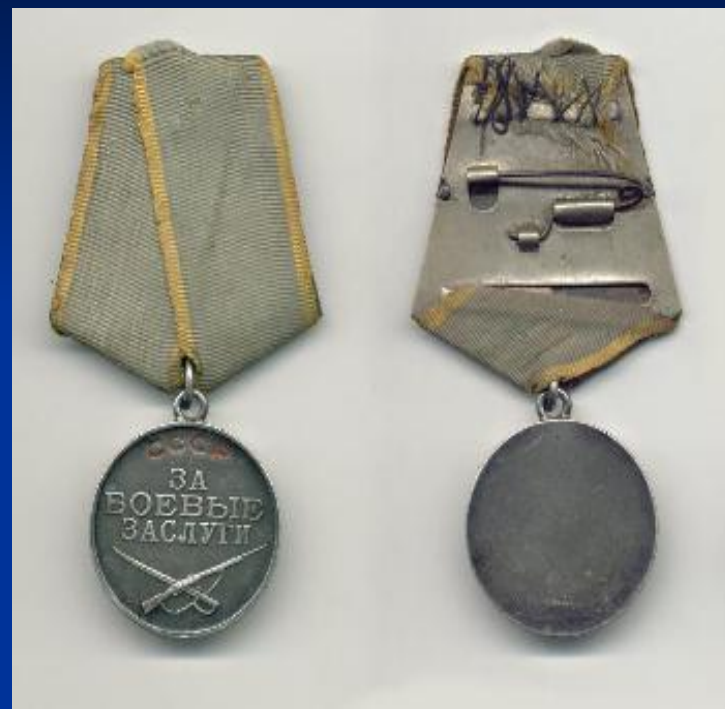
Медаль за боевые заслуги