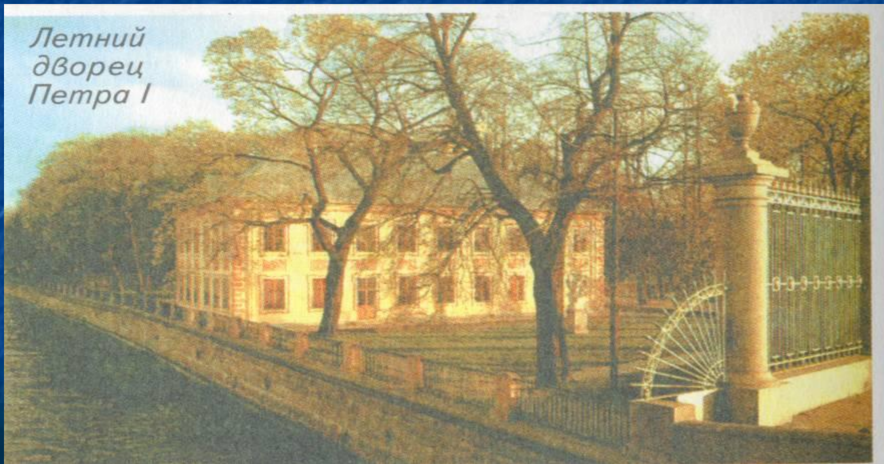
Архитектор Д. Трезини