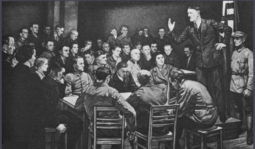
Виступ А.Гітлера на одних з перших зборів нацистів