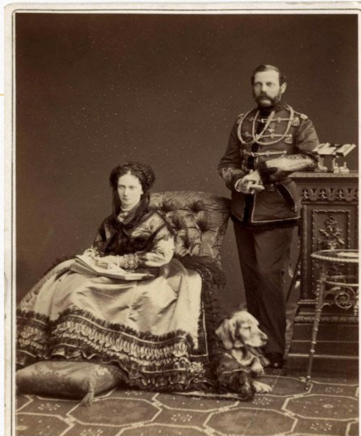
ЛЕВИЦКИИ на Мойкѣ, 30 С. Петербургъ.