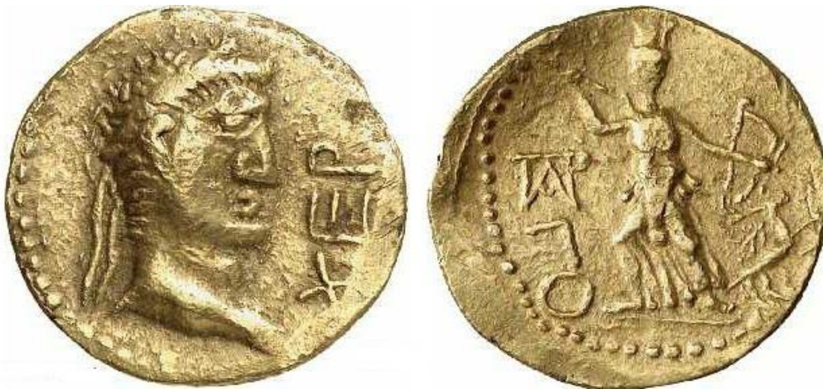
Римские монеты, найденные в Крыму