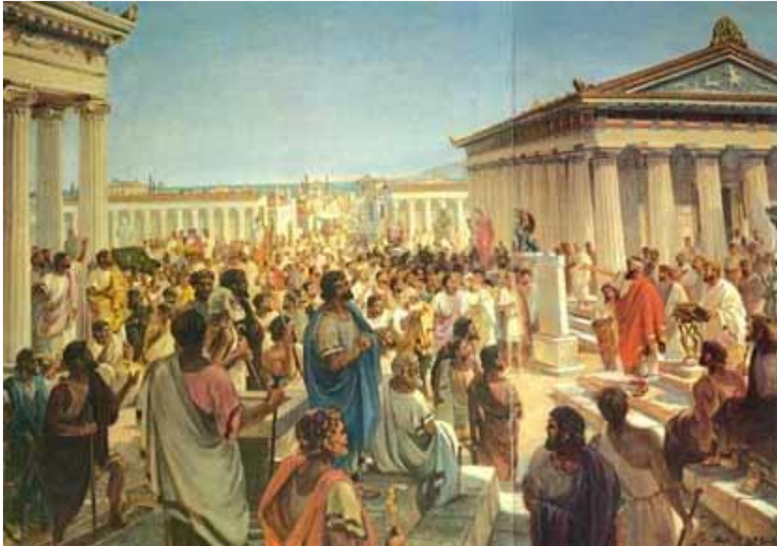
Присяга граждан «Херсонеса»