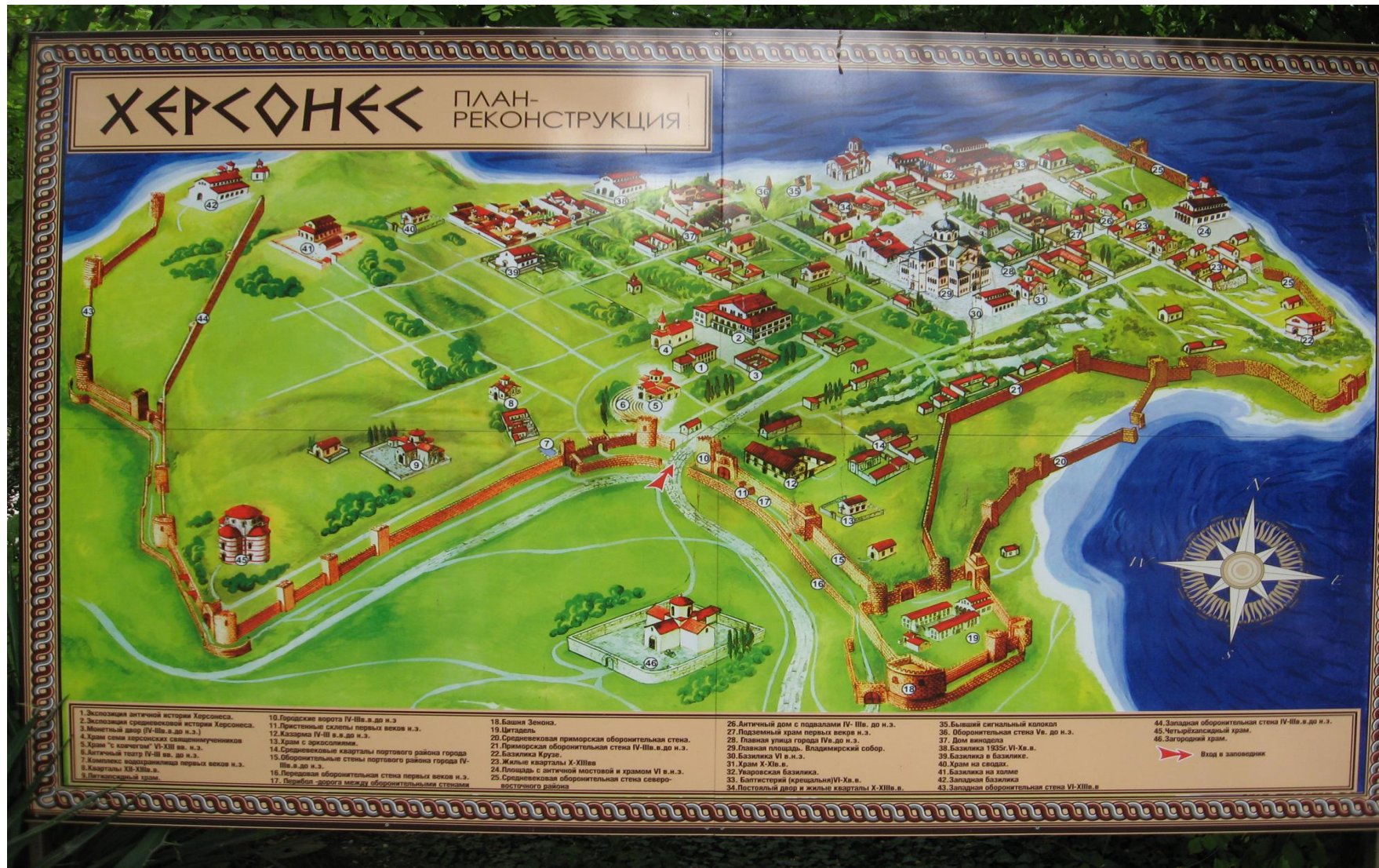
Схематичное изображения города «Херсонес»