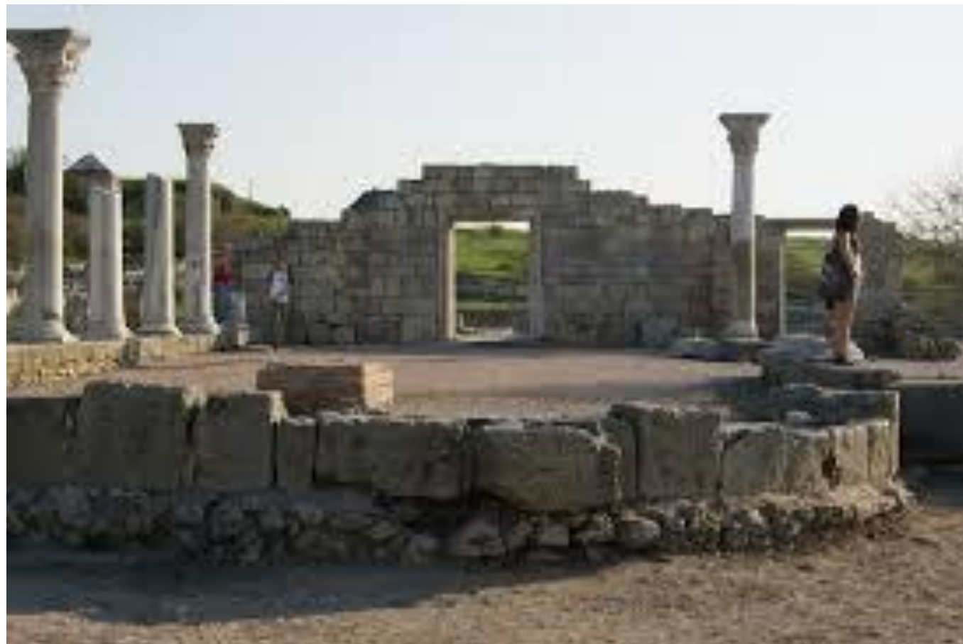
Античный полис «Херсонес»