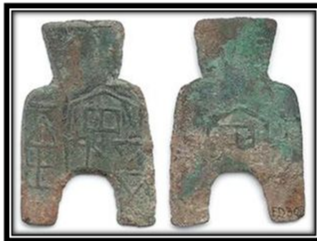
Первые китайские монеты (около 500 г. до н.э.) делали из бронзы в форме орудий труда и раковин каури, служивших ранее деньгами.