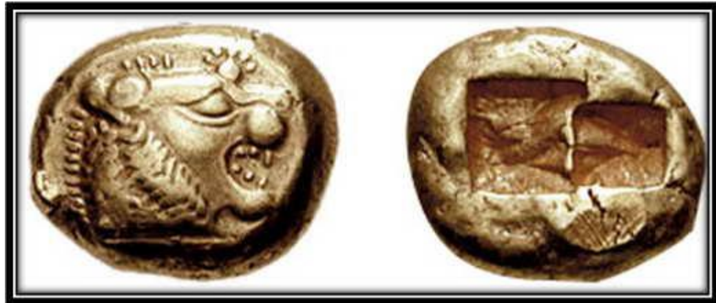
Лидийская монета VI века до н. э. (трите, одна треть статера)