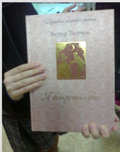
Оформление обложки книги, альбома

В этой технике можно делать много красивых вещей: картины (панно), открытки, украшения на окна и многое другое.