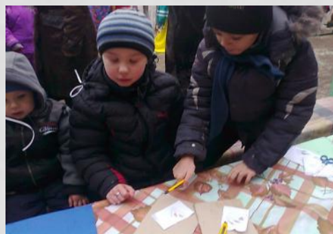
Мастер-класс на празднике «Масленица»