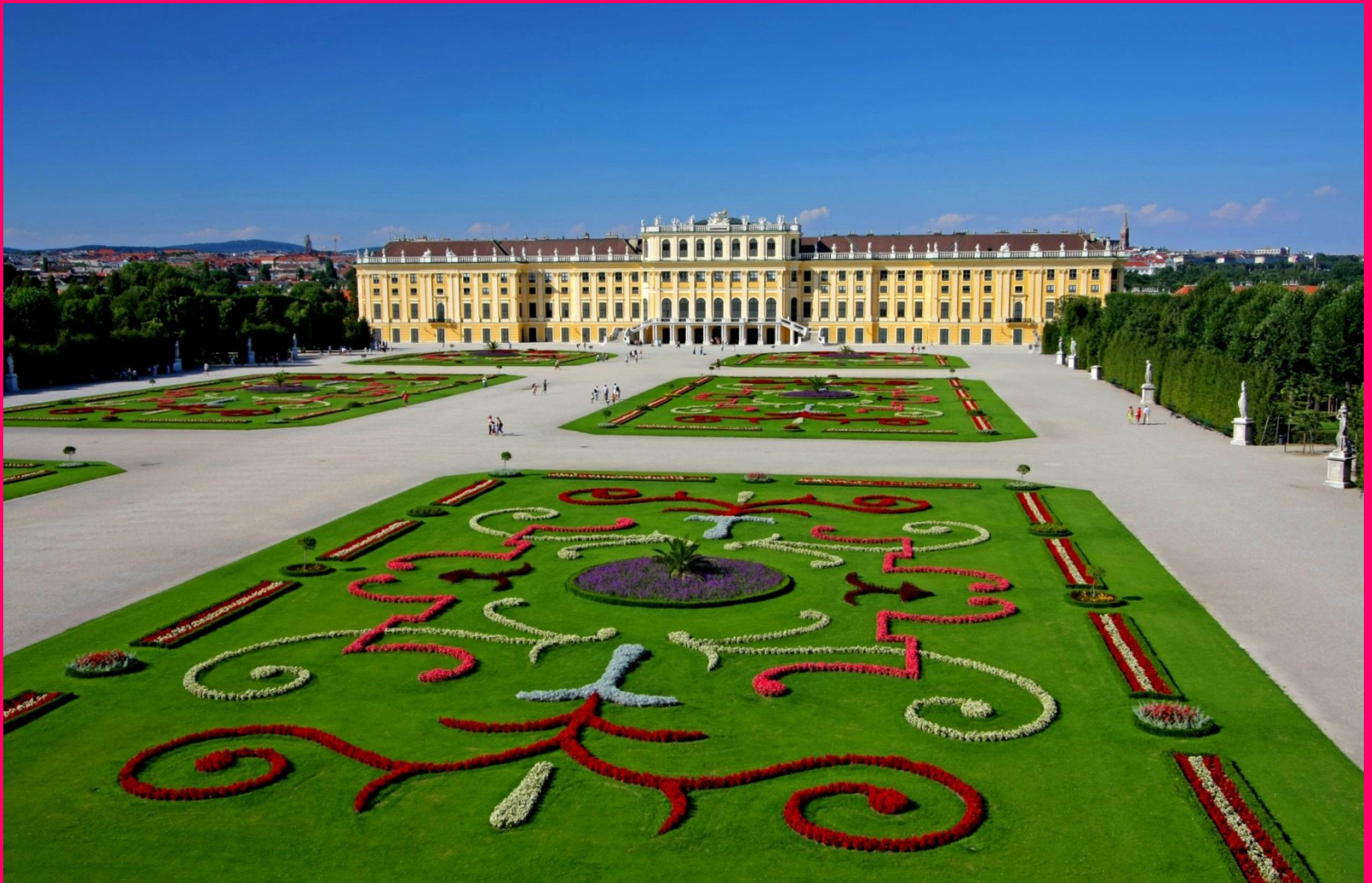
Schönbrunn letné sídlo Habsburgovcov pri Viedni