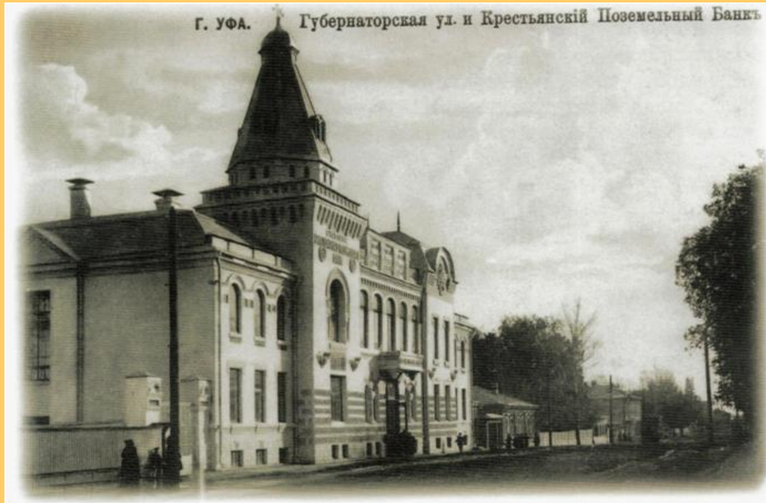
Ул. Губернаторская (Советская)