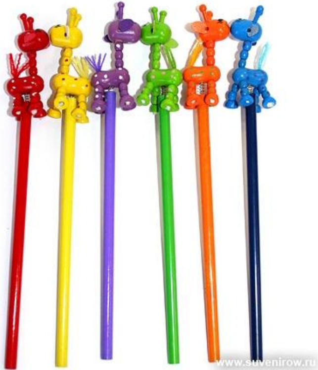
Карандаши с игрушками.