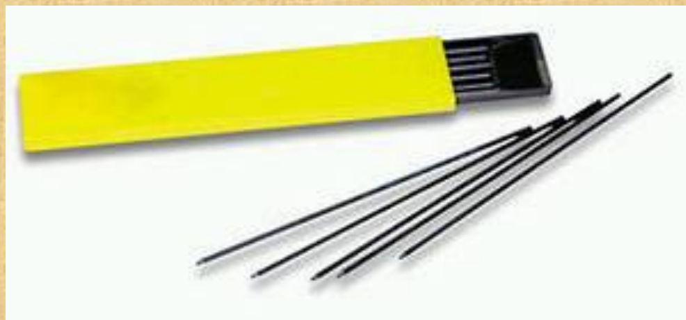
Карандаши со сменным стержнем.