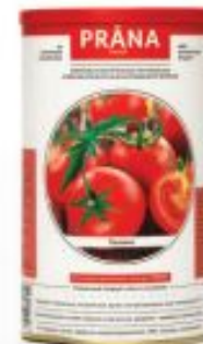
Гаспачо с сельдереем