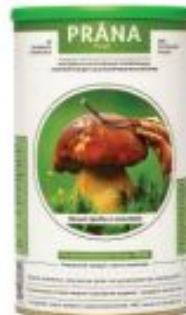
Белые грибы и шиитакэ