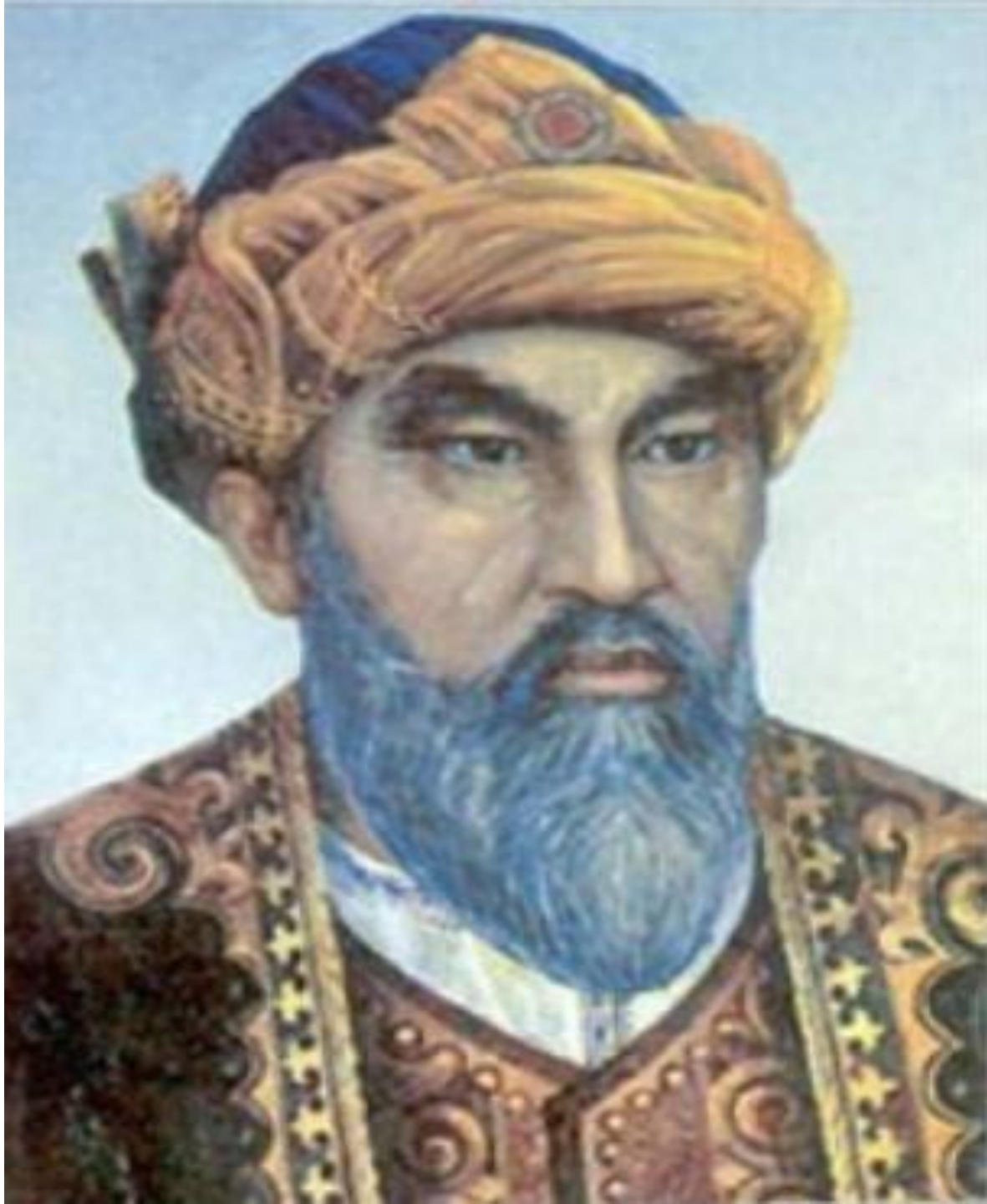
Дулати Хұсайынұлы Мұхаммед Хайдар (1499-1551)