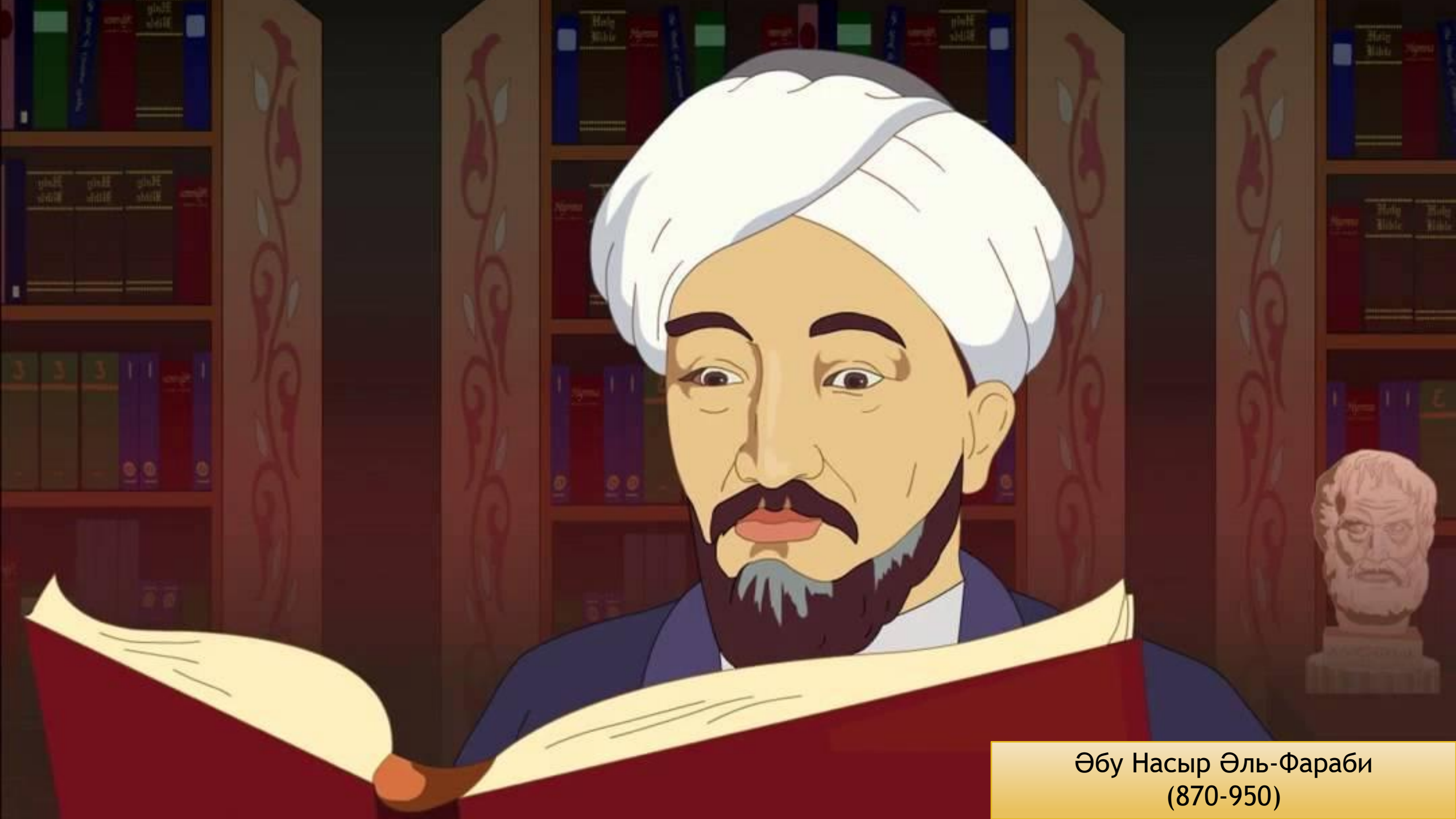
Әбу Насыр Әль-Фараби (870-950)