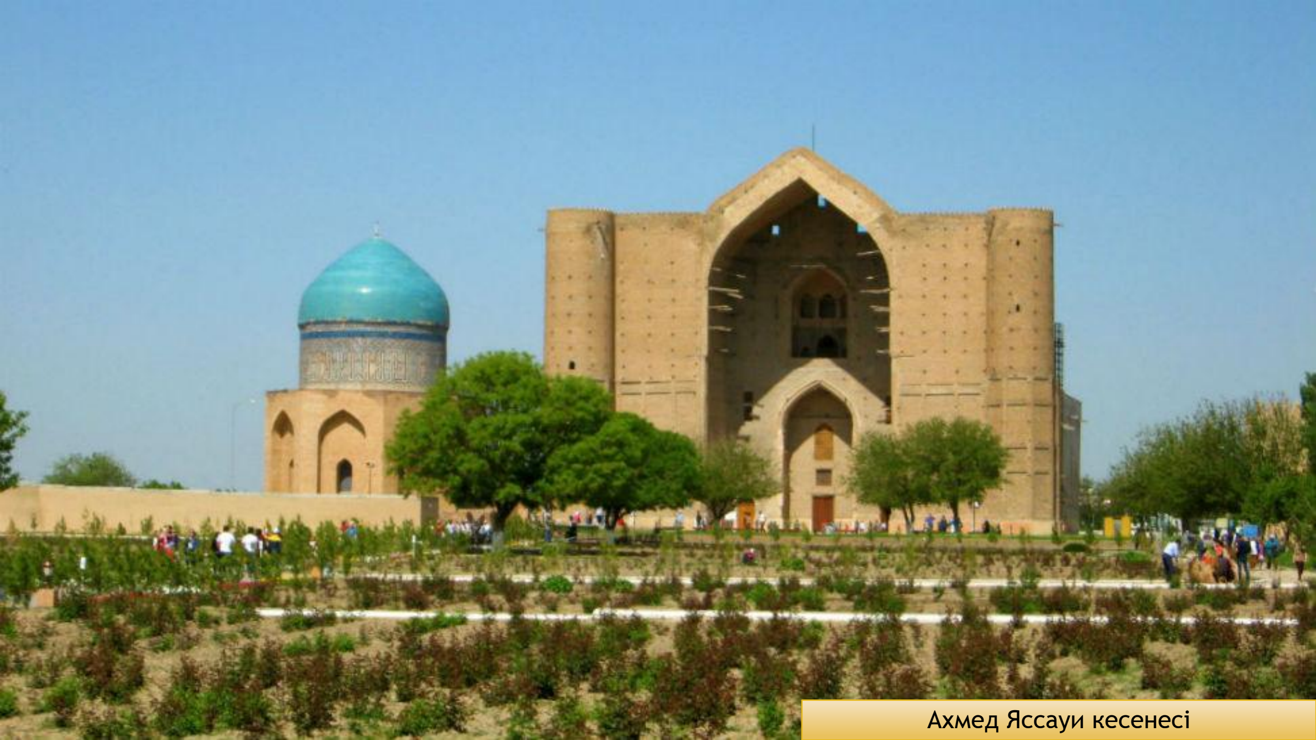
Ахмед Яссауи кесенесі