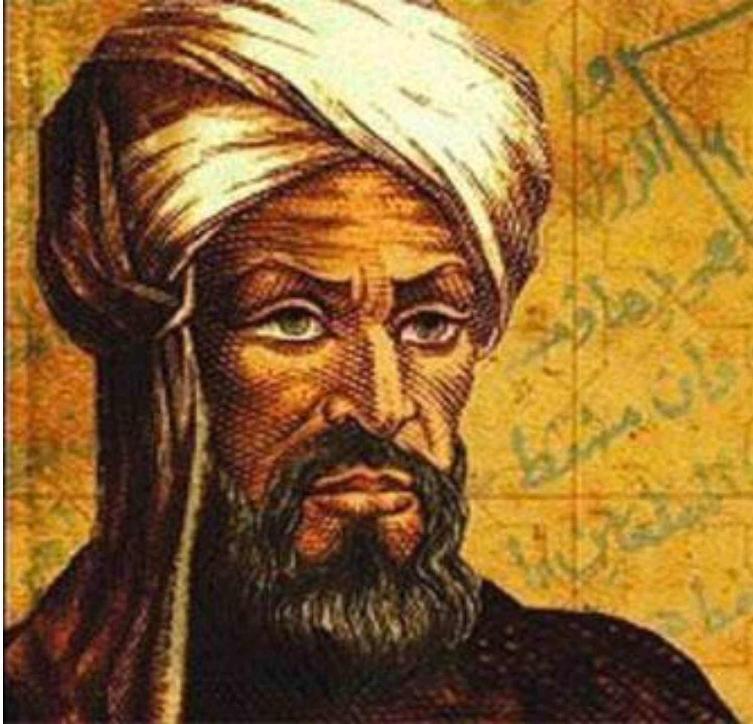
Ахмет ИҮгінеки (XIIғ.соңы-XIIIғ. басы)