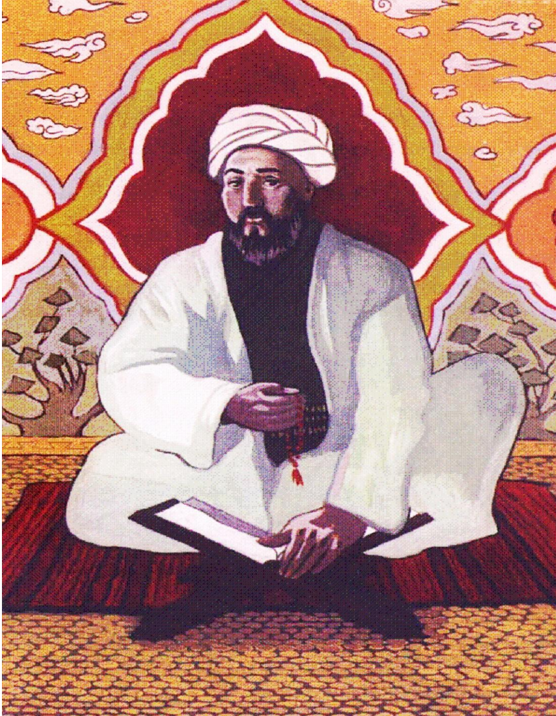
Қожа Ахмет Яссауи (1103-1167)