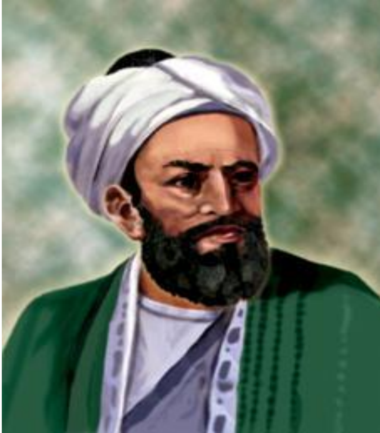
Әбу Райхан әл-Бируни (973-1050)