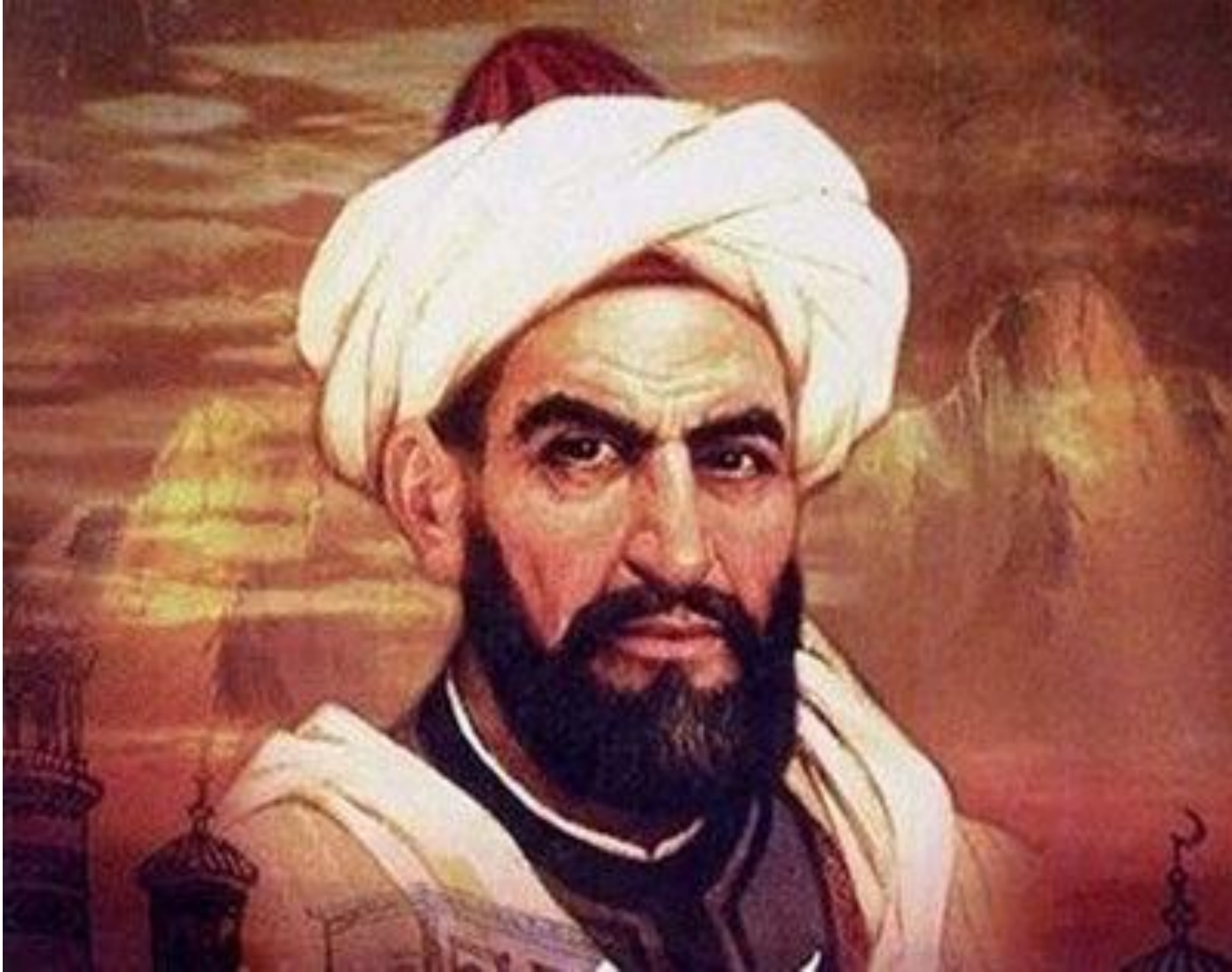
Махмұд Қашқари (1029–1101)