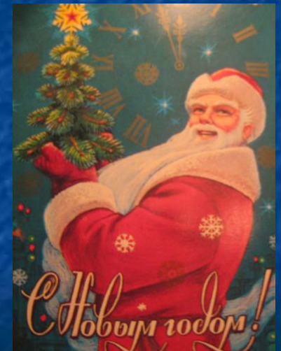
5-я станция «НОВОГОДНЯЯ»