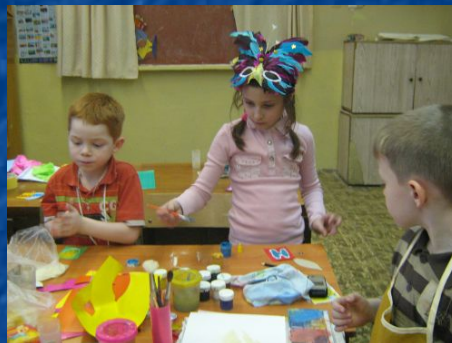
Создание и роспись флажков с буквами.