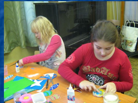
Изготовление плоских новогодних игрушек