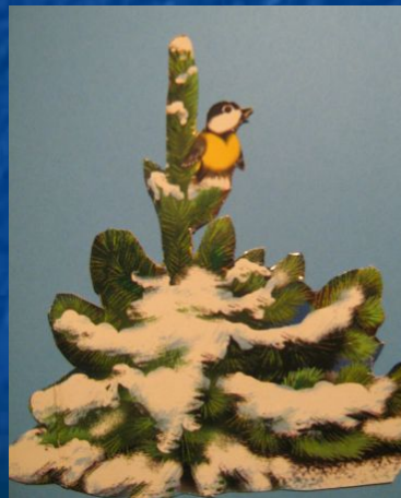
3-я станция «ЕЛОЧНАЯ»