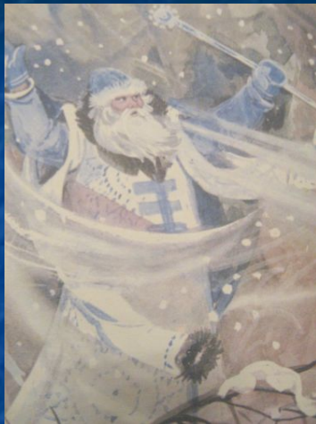
2-ая станция «МОРОЗНАЯ»