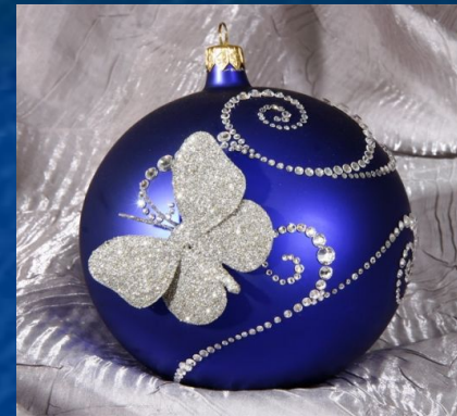
4-я станция «Станция игрушек»