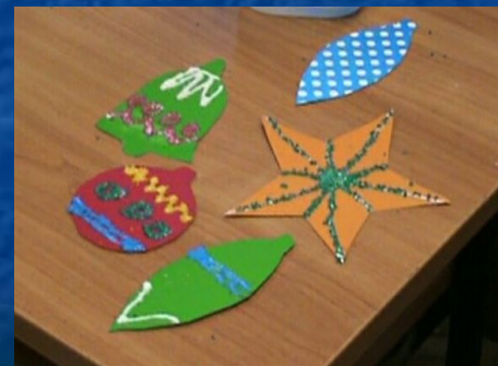
Вариант готовых игрушек.