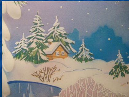
1-ая станция «ЗИМНЯЯ»