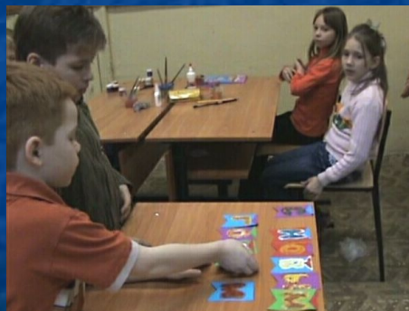
Составление слова из готовых флажков.