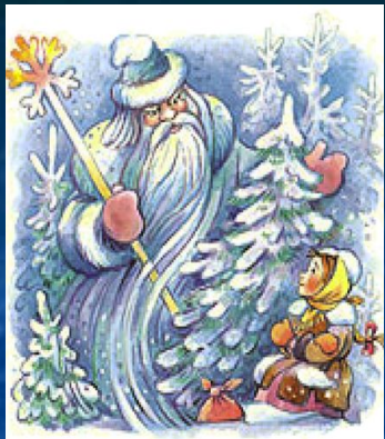
Б.А.Акулиничев. Иллюстрация к русской народной сказке «Морозко»