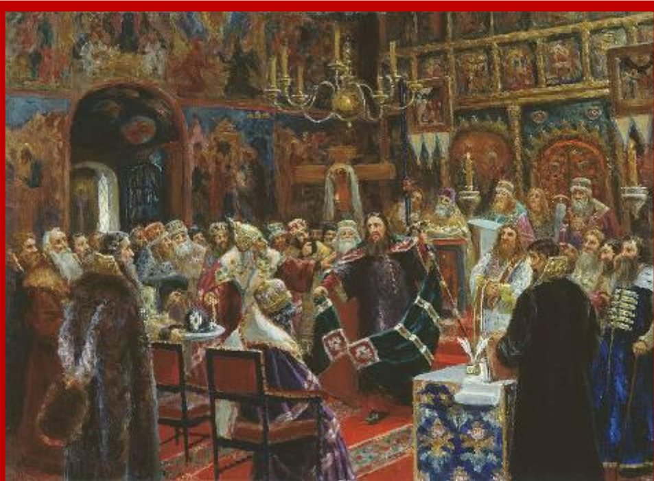
Суд над патриархом Никоном (С. Д. Милорадович, 1885 год)