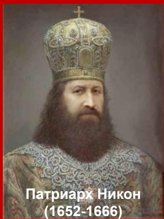
Патриарх Никон (1652-1666)

Запись 1652 г. – избрание Никона новым патриархом России