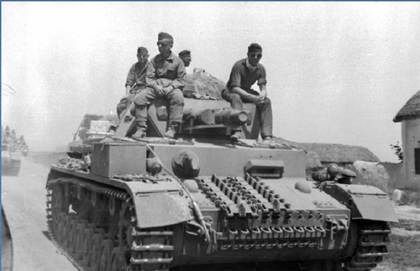
Наступление немецких войск.