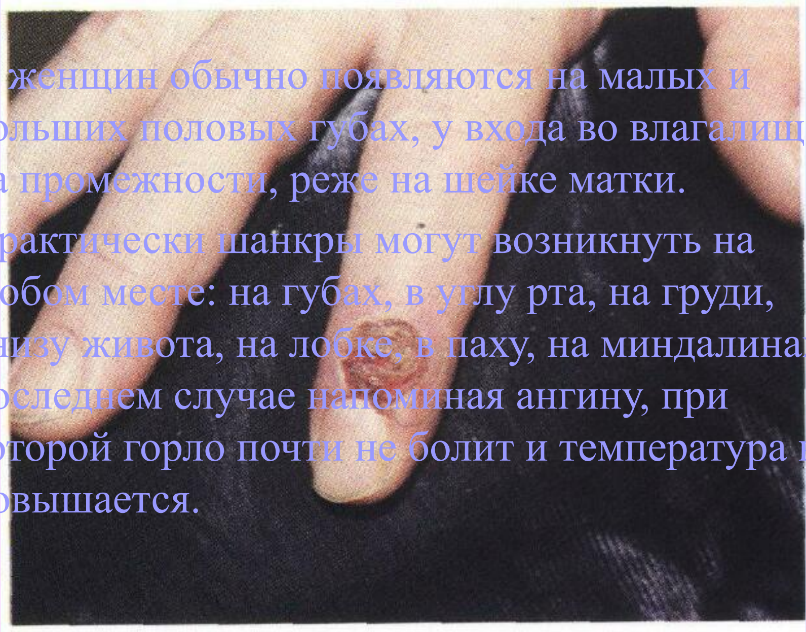
Твёрдый шанкр на указательном пальце.