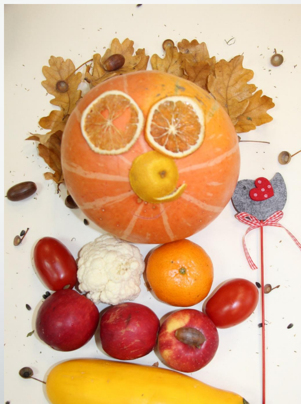
Лантратова Ульяна 10л