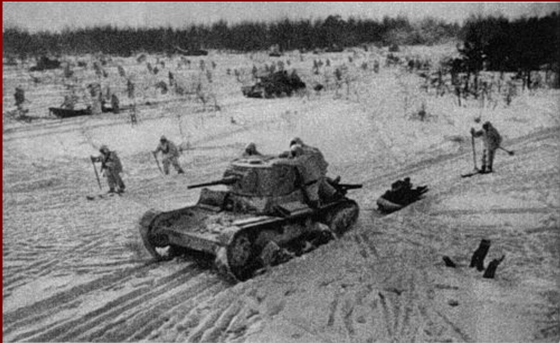
Битва под Москвой.