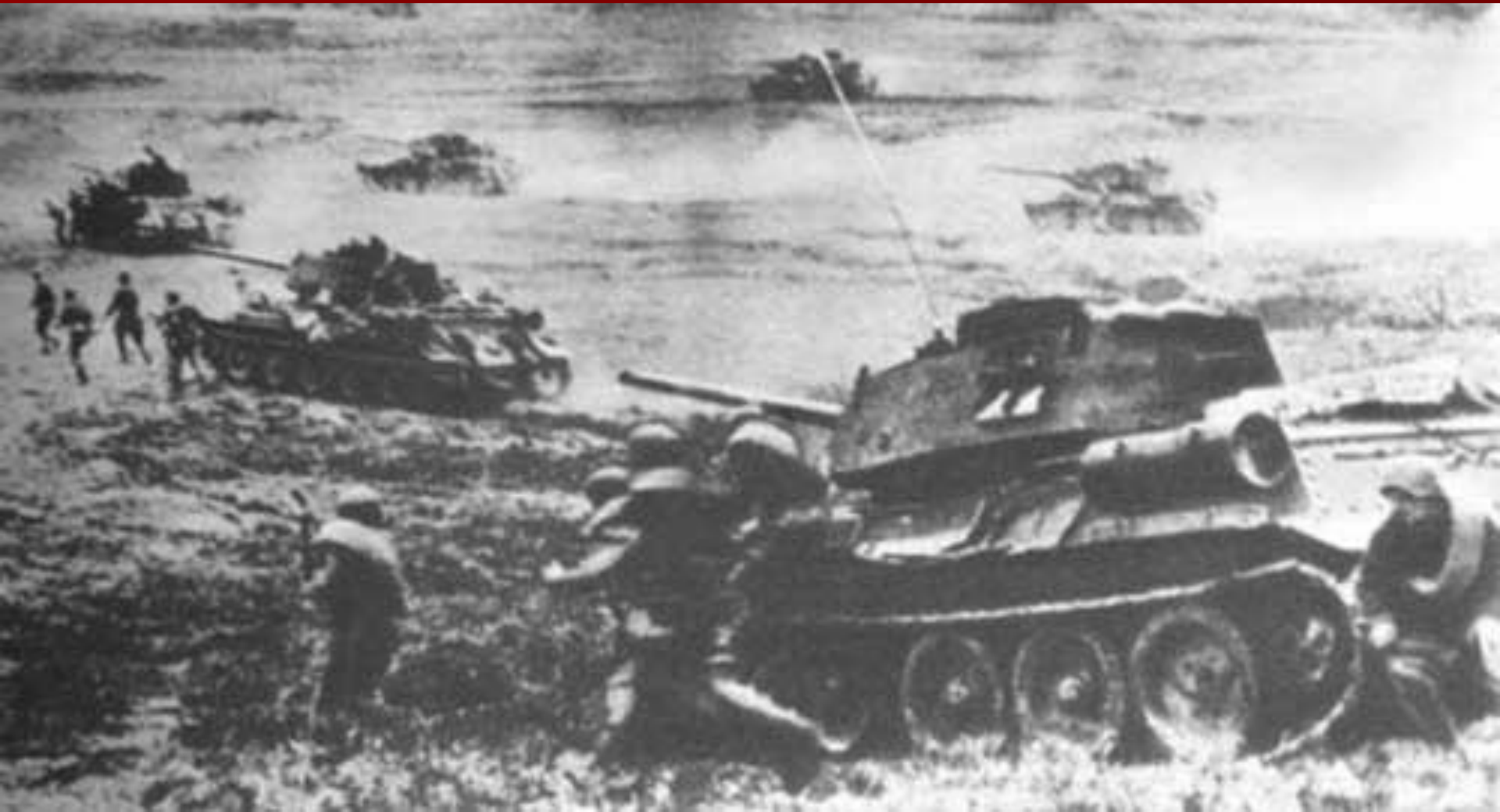
Танковое сражение под Прохоровкой.