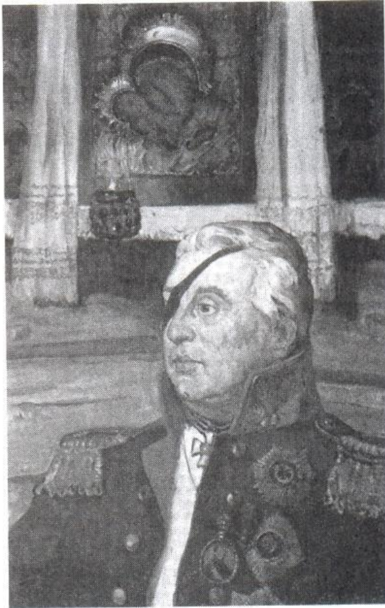
Генерал-фельдмаршал М. И. Кутузов