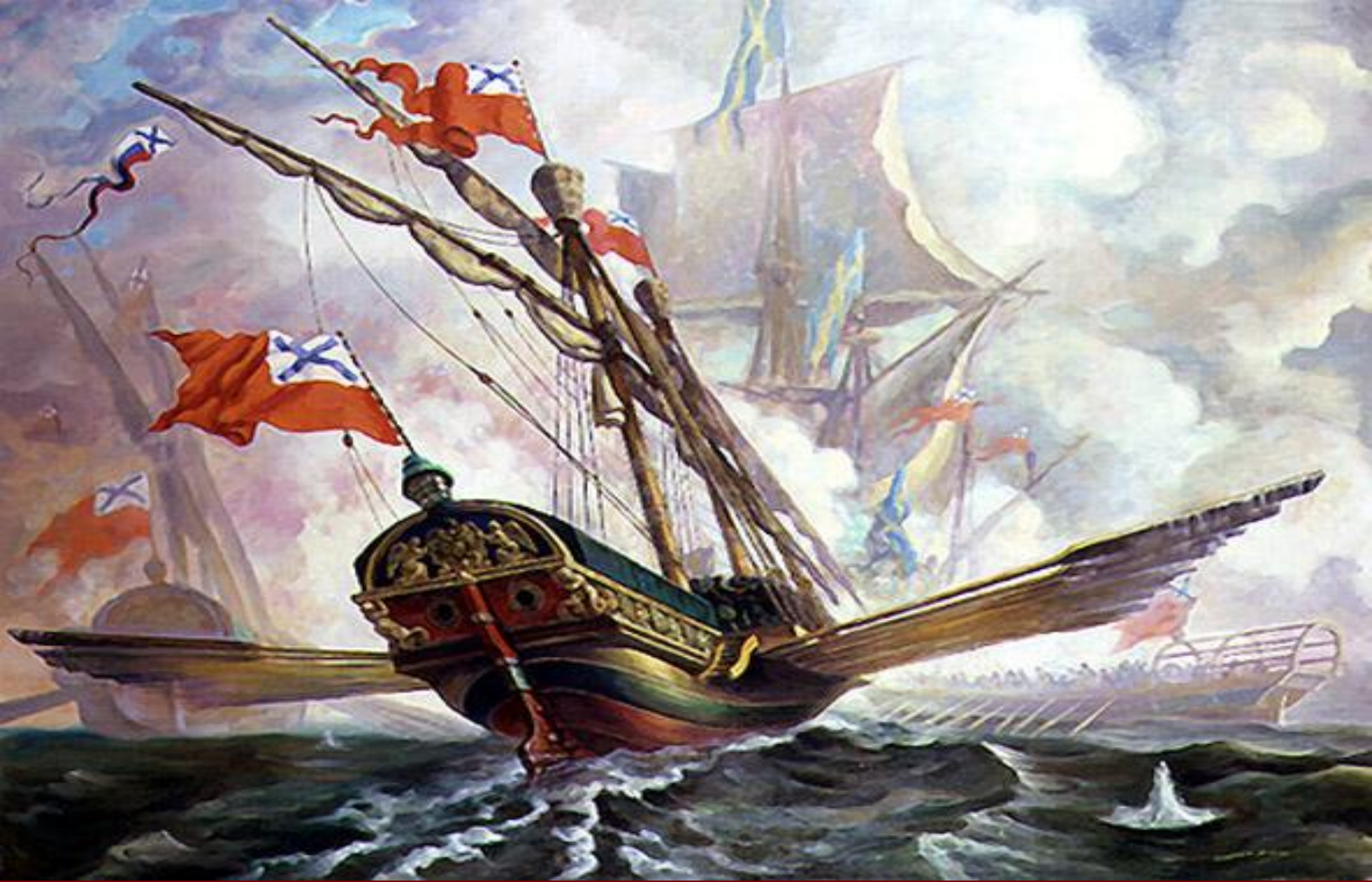
Победа у мыса Гангут.