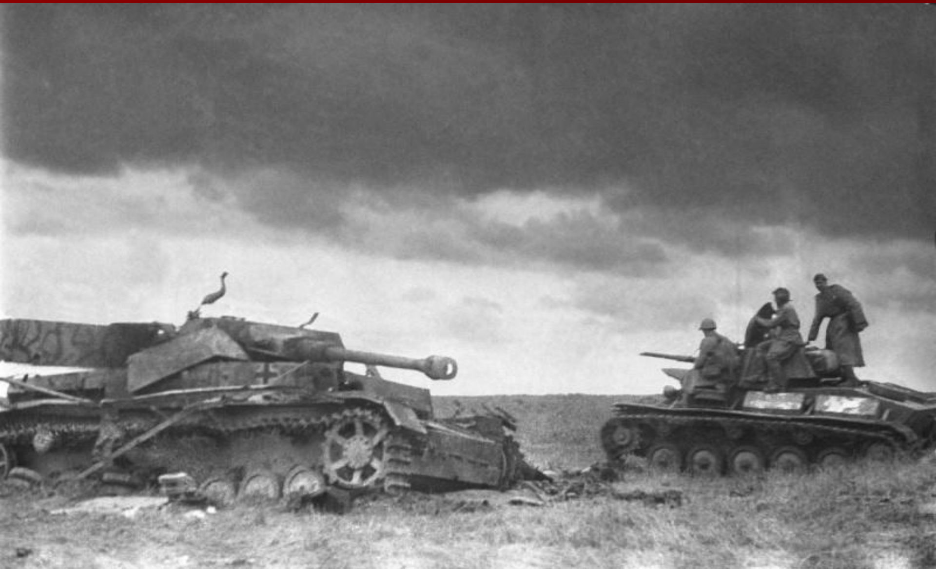
Подбитые танки в Курском сражении.