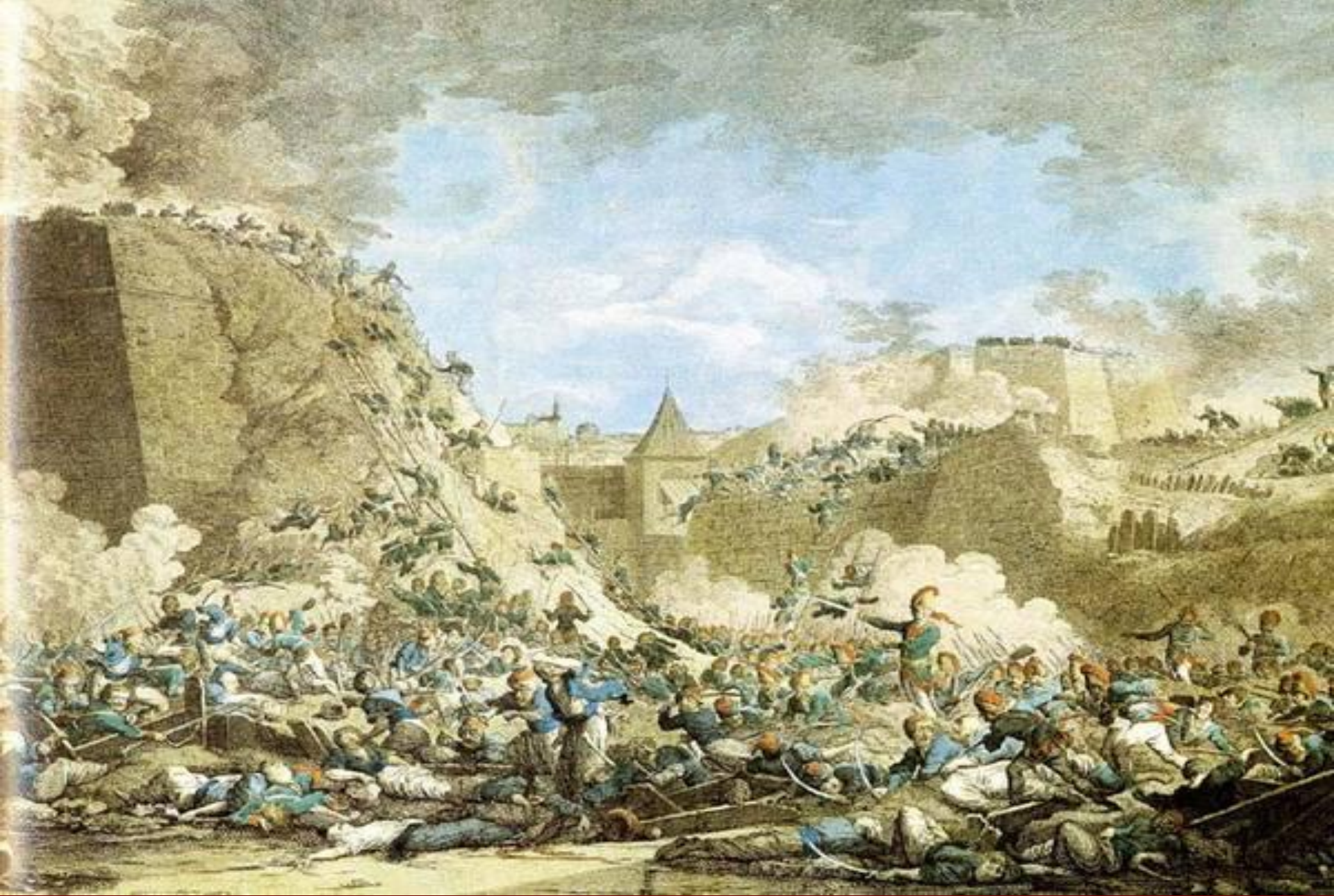
Взятие турецкой крепости Измаил.