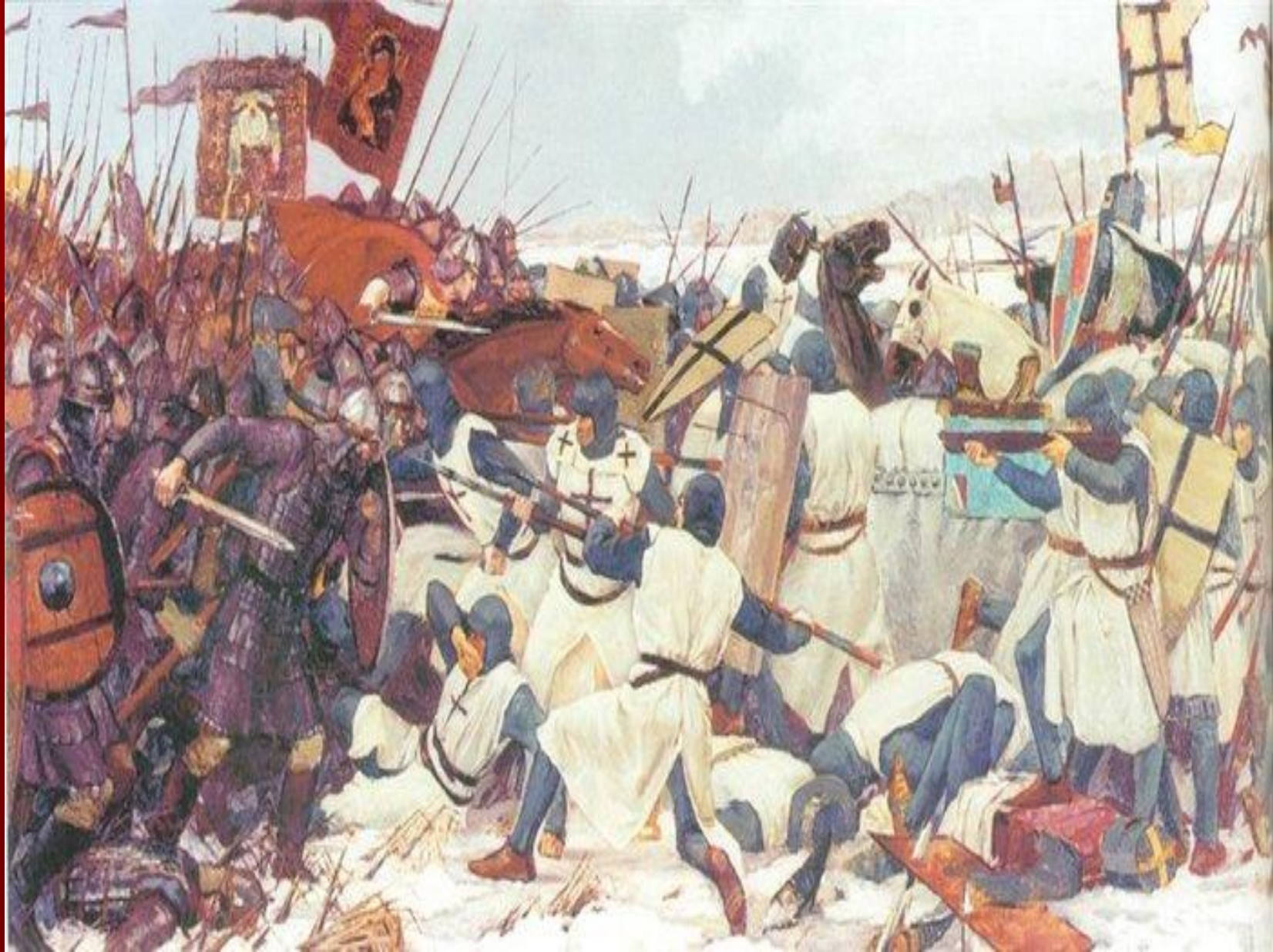
Ледовое побоище, 1242