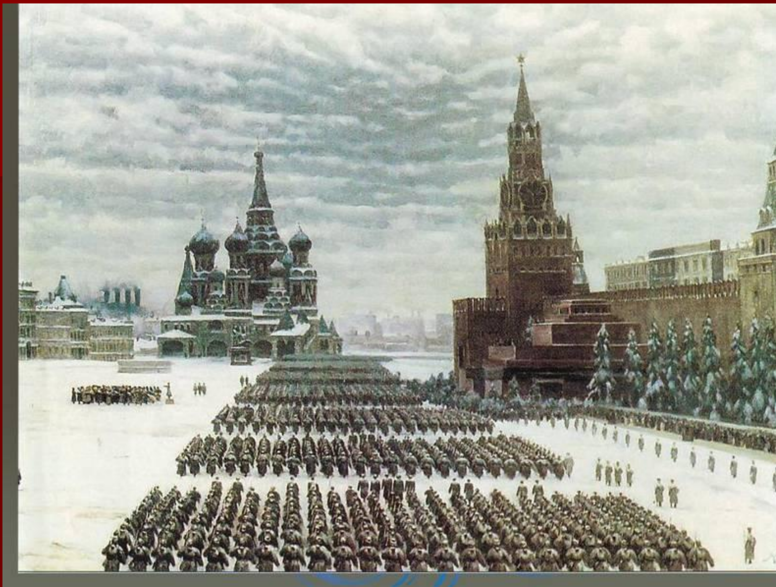
7 ноября 1941г парад советских войск перед контрнаступлением под Москвой.