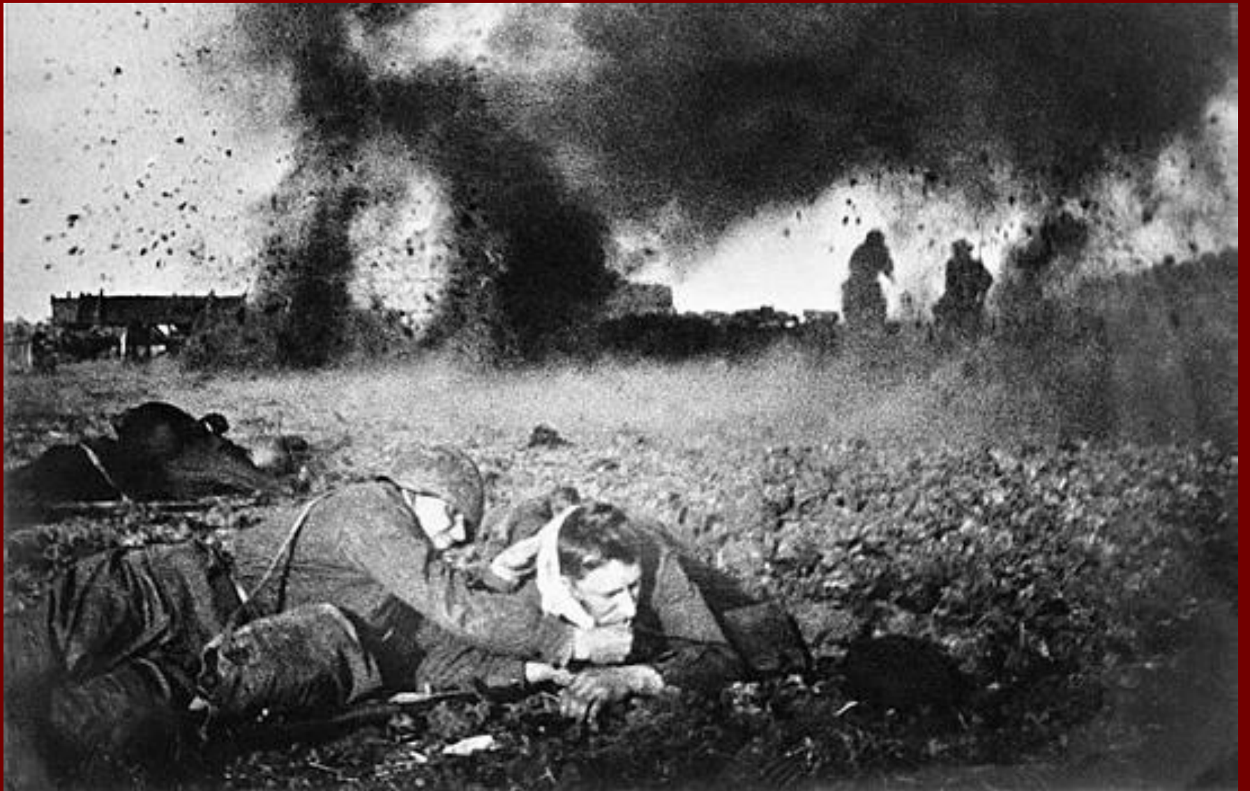
Битва под Москвой.