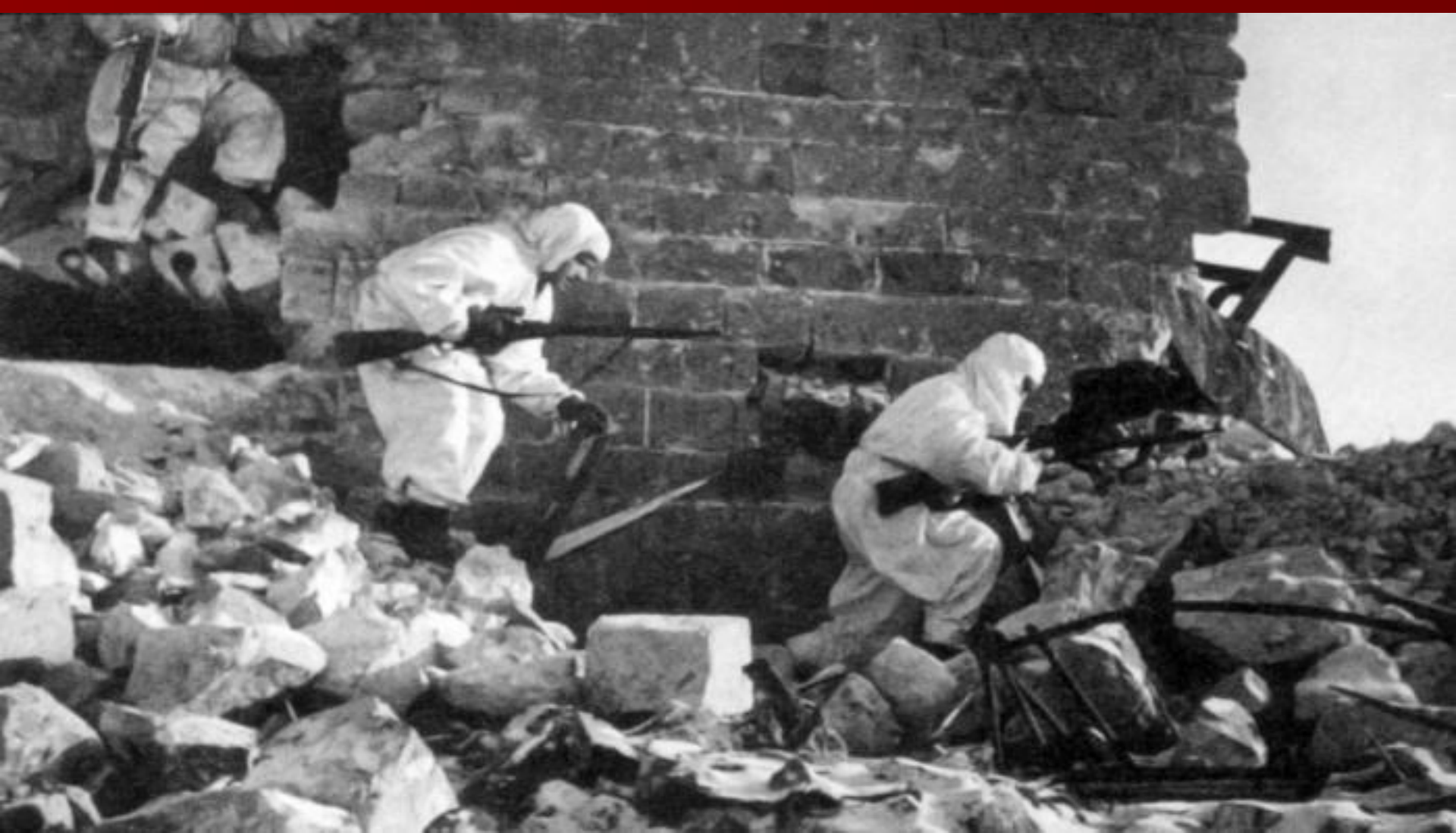
Советские снайперы в Сталинграде.