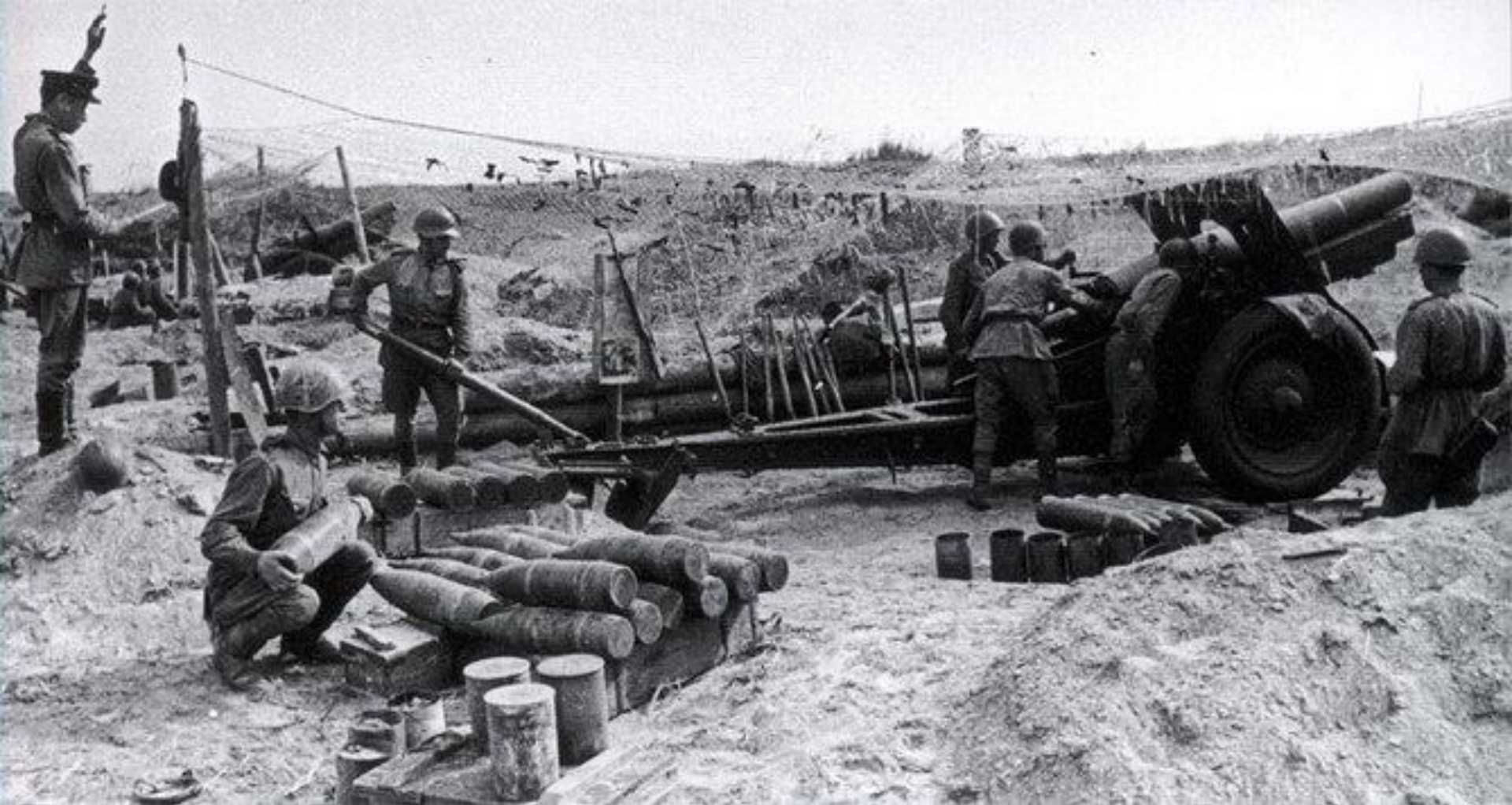
Битва за Ленинград.