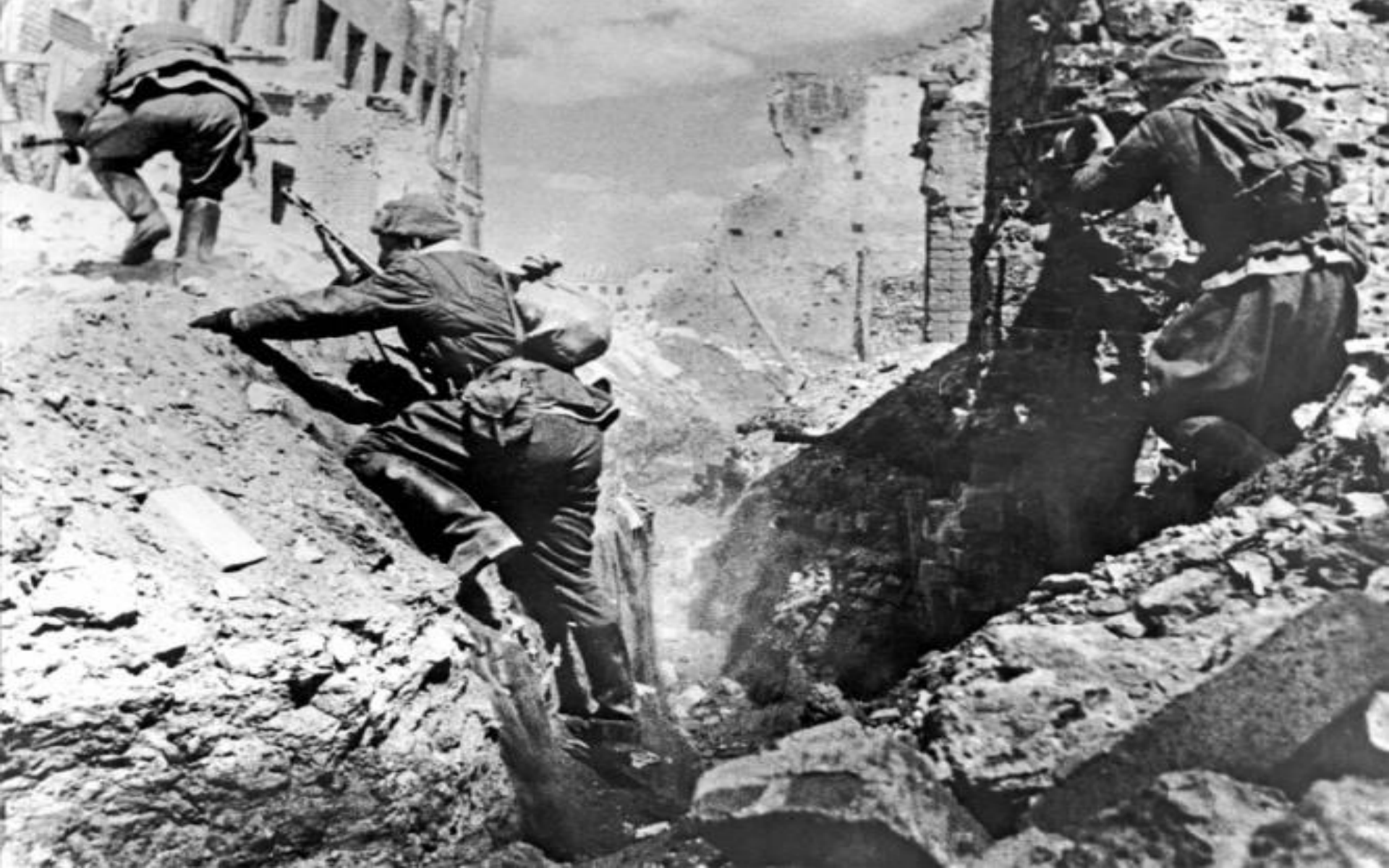
Атака советских разведчиков в Сталинграде.