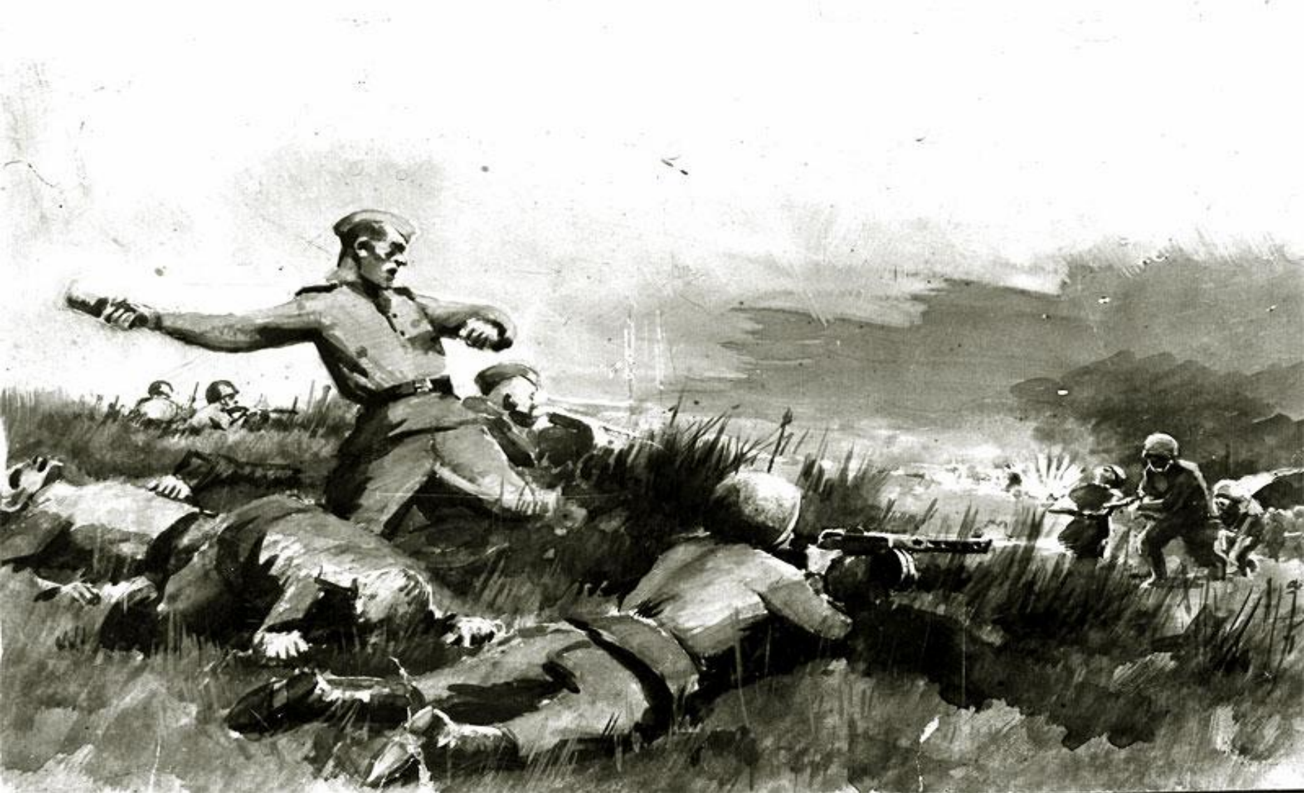
Подвиг советских пограничников под Курском.