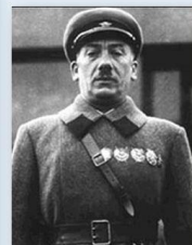
Генрих Ягода, создатель системы ГУЛАГ, расстрелян в 1938 г.