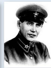
Николай Ежов председатель НКВД, расстрелян в 1940 г.