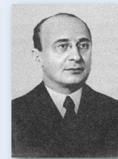
Лаврентий Берия, председатель НКВД, расстрелян в 1953 г.