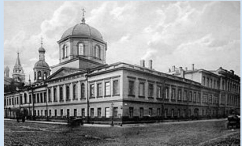
Первая Санкт-Петербургская классическая гимназия