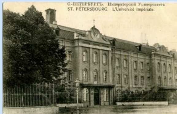
Петербургский Педагогический университет