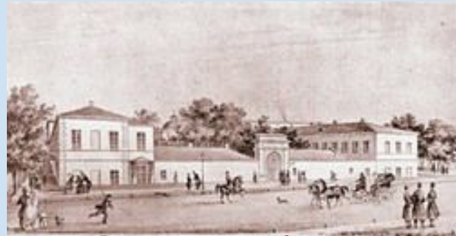
Ришельевский лицей в Одессе