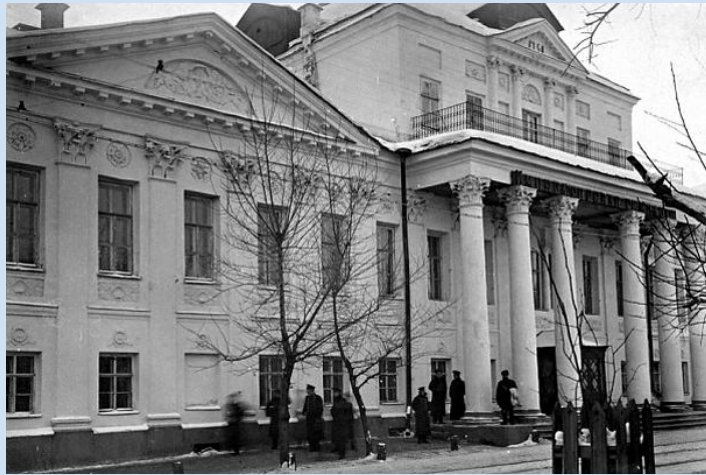
Гимназия в Казани