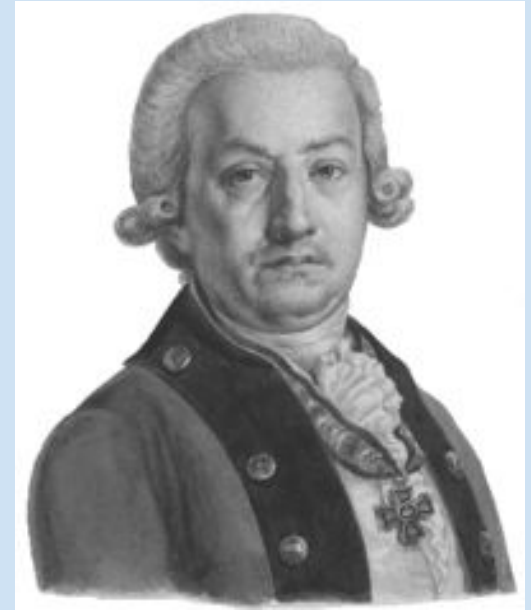
Фёдор Иванович Янкович (де Мириево), педагог, был в составе Главного управления училищ