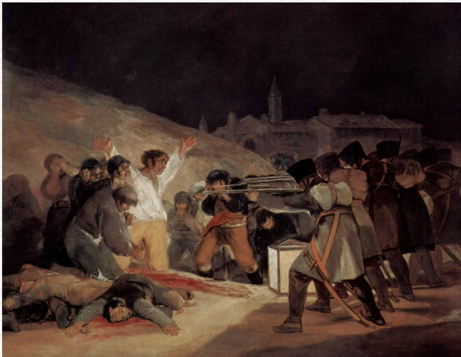
Расстрел повстанцев в ночь на 3 мая 1808 года Около 1814 Холст, масло. 268 x 347 см Музей Прадо, Мадрид