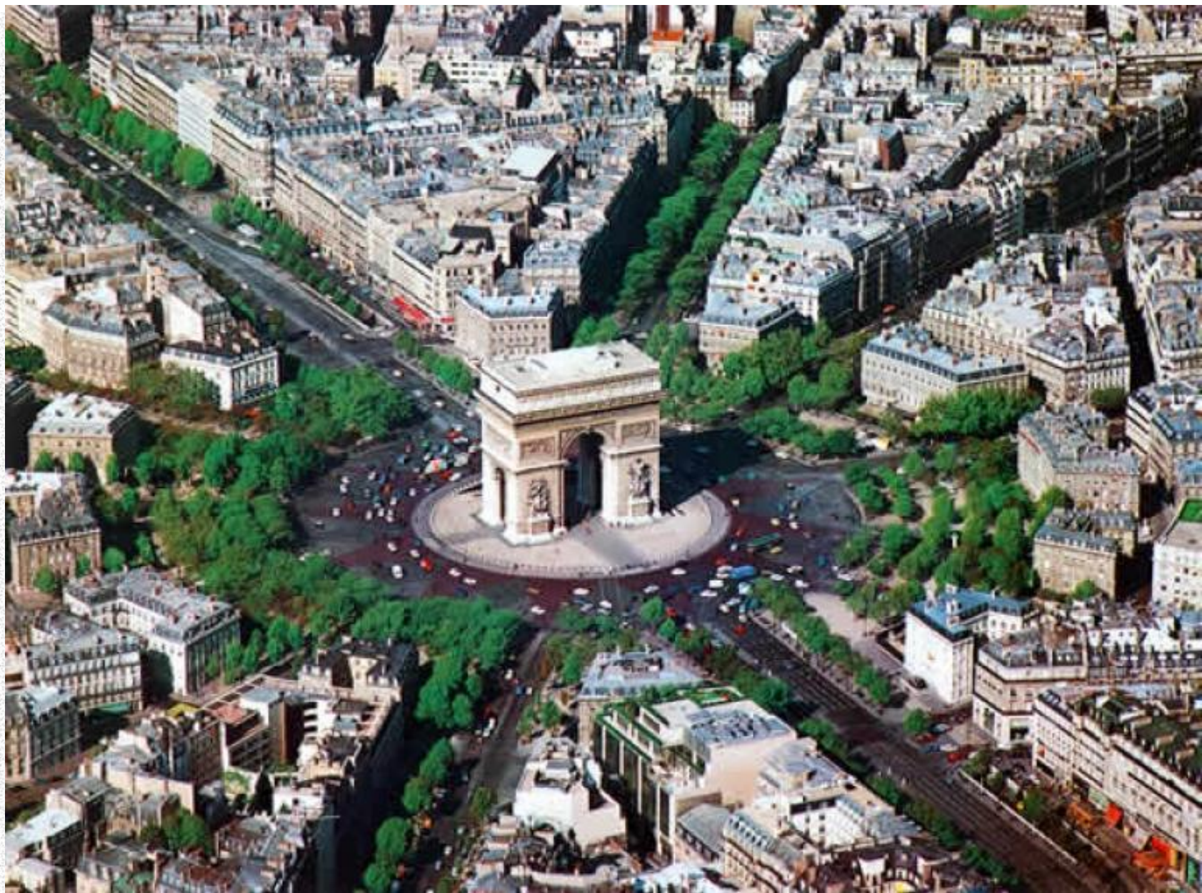
Триумфальная арка в Париже. Арх. Жан Франсуа Шальгрен и др.