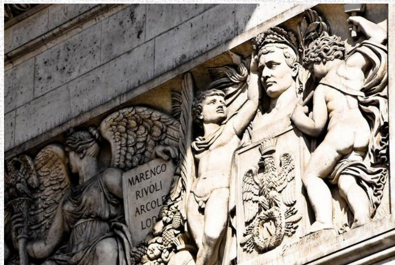
Триумфальная арка в Париже. Арх. Жан Франсуа Шальгрэн и др. Фрагменты