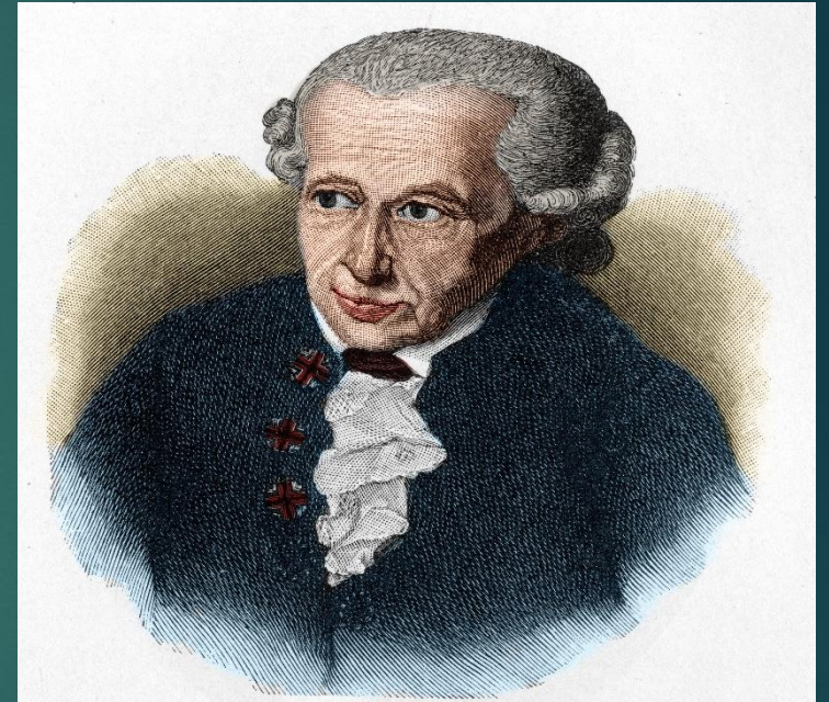
И. Кант. «Критика чистого разума».

Многообразные представления, данные в некотором созерцании, не были бы все вместе МОИМИ представлениями, если бы они не принадлежали все вместе одному самосознанию.