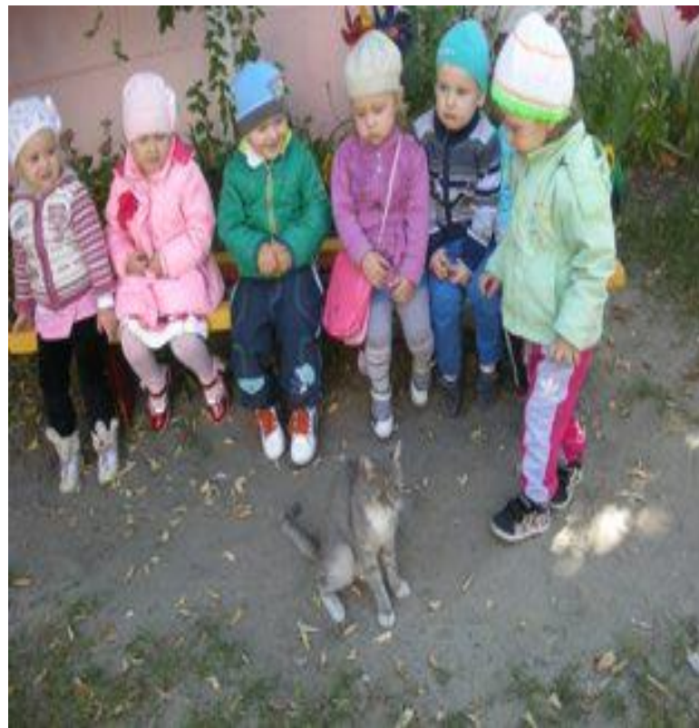
Наблюдение за кошкой