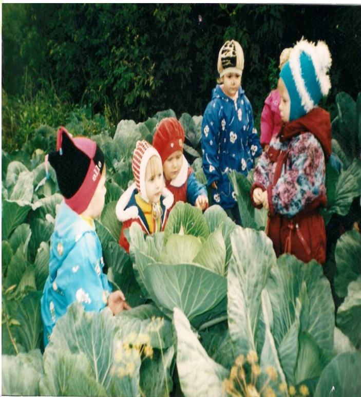
Наблюдение за капустой