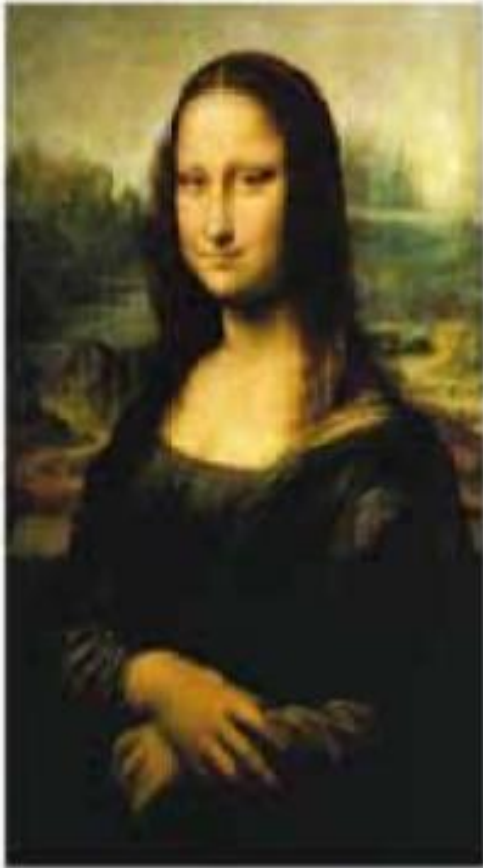
о. Леонардо да Вінчі. Мона Ліза (1503 р.)