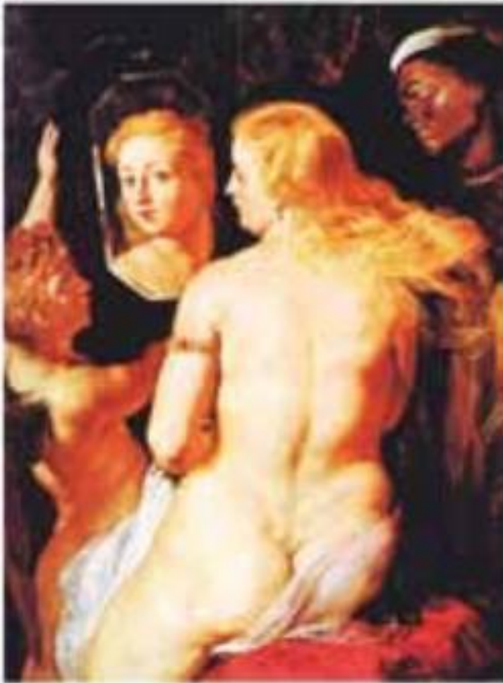
Рубенс. Ранковий туалет Венери. (1612—1615 рр.)

Ідеали краси залежали від історичних умов і допомагала людям пристосуватися до них. Наприклад, у голодні віки цінувалася повнота. Вона свідчила про здатність людини здобувати їжу й забезпечувати себе і своїх нащадків усім необхідним для виживання.