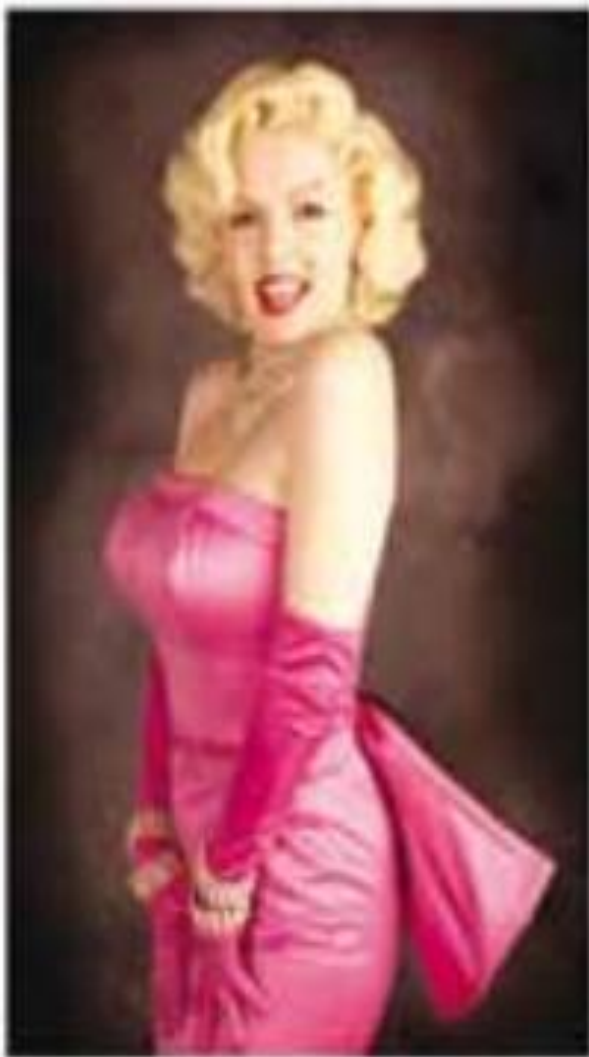
Акторка Мерилін Монро (1926 – 1962 рр.)