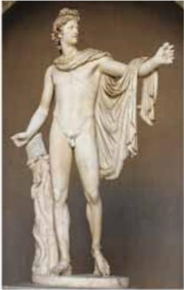
Леохар. Аполлон Бельведерський (330—320 рр. до н. е.)

В епоху класичної Греції (V-IV ст. до н.е.) краса була предметом культу. Статуї бога Аполлона встановлювали в багатьох оселях, бо люди вірили, що це допоможе їхнім нащадкам перейняти його божественну вроду. Платон вважав, що кожна людина повинна мати три бажання: бути здоровою, красивою і розбагатіти чесним шляхом.