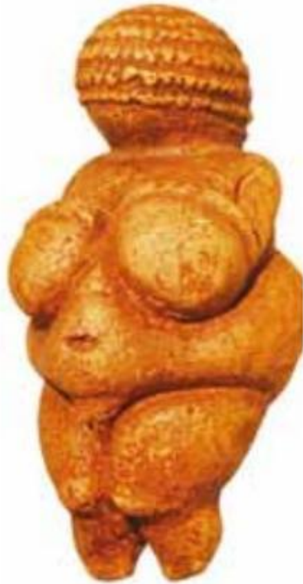
Венера з Віллендорфа (XX ст. до н. е.)