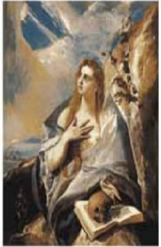
Ель Греко. Марія Магдалина, яка кається (1580 р.)