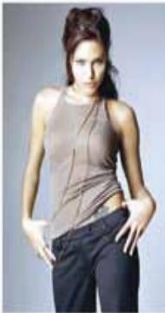
Акторка Анджеліна Джолі (1975 р.)

У наш час, струнка, підтягнута статура свідчить про наявність можливостей для підтримання доброї фізичної форми. Адже відомо, що надмірна вага пов'язана з ризиком багатьох захворювань, від яких люди хотіли би уберегтися самі й захистити своїх дітей.