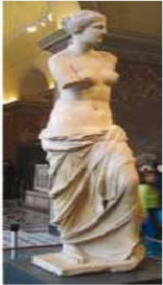
Венера Мілоська (1485 р.)