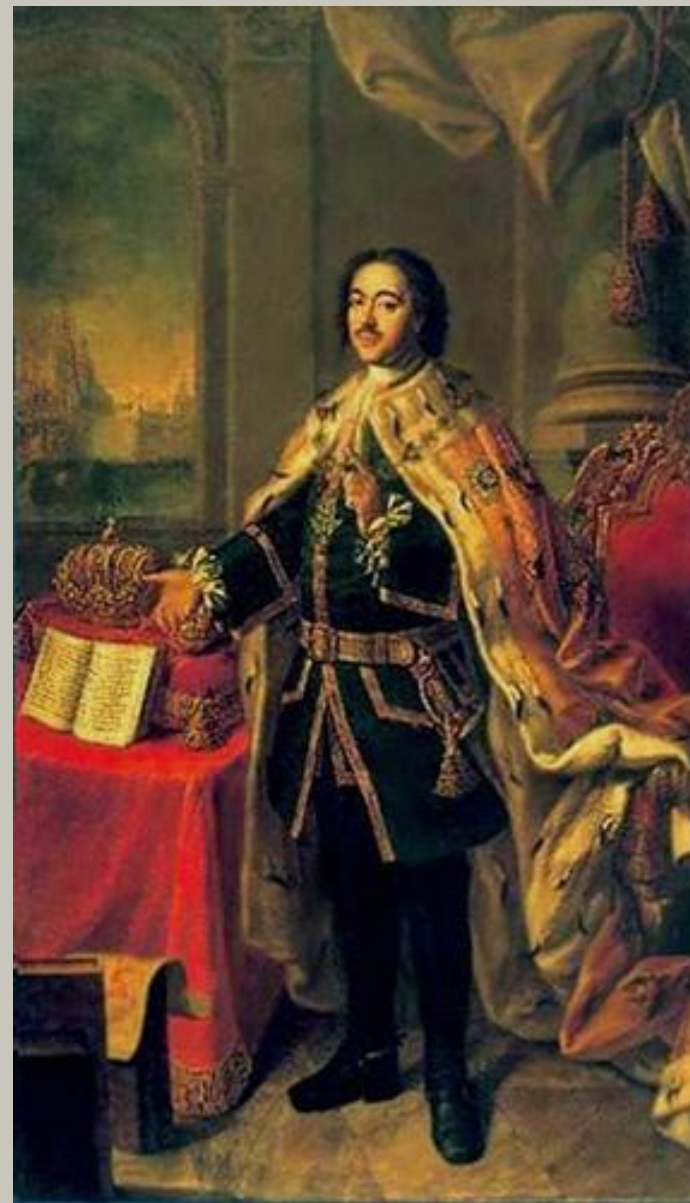
Портрет Петра I. 1770. ГРМ Холст, масло. 286 x 159 Государственный Русский музей

В конце 1760-х годов, художник продолжает много работать. В эти годы пишет парадный портрет Петра I, созданным для синодальной членской палаты. Художник использует традиционные, атрибуты парадного царского портрета. Следуя схеме, Антропов изображает стол с царскими регалиями, тронное кресло, обязательную колонну и столь же обязательную драпировку.