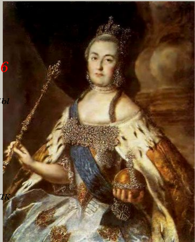
Портрет Екатерины II. 1766. Волгоградский музей Холст, масло. 100 x 82 Волгоградский музей изобразительных искусств.

В период с 1764 по 1766 гг. А.П. Антропов исполнил много портретов Екатерины II, главным образом с оригиналов иностранных художников. Портрет, несомненно, предназначался для какого-либо присутственного места, так как в каждом официальном учреждении должно было находиться императорское изображение.