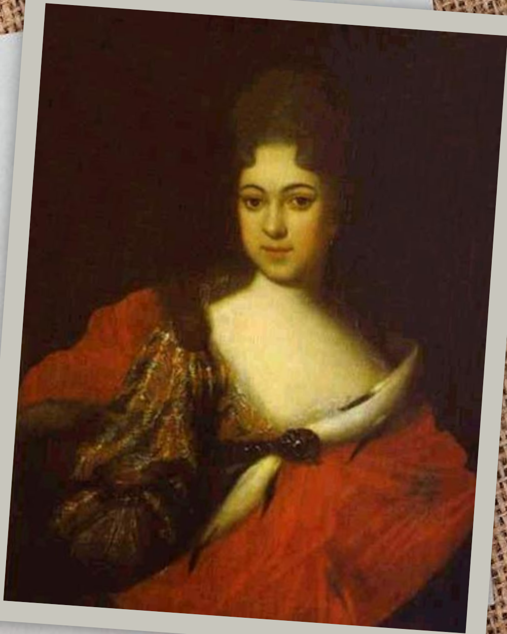
Портрет царевны Прасковьи Ивановны. 1714. ГРМ Холст, масло. 88 x 67,5