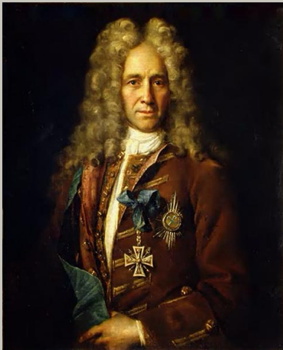
Портрет графа Г.И. Головкина. 1720-е гг. ГТГ Холст, масло. 90,9 x 73,4 Третьяковская галерея, Москва.