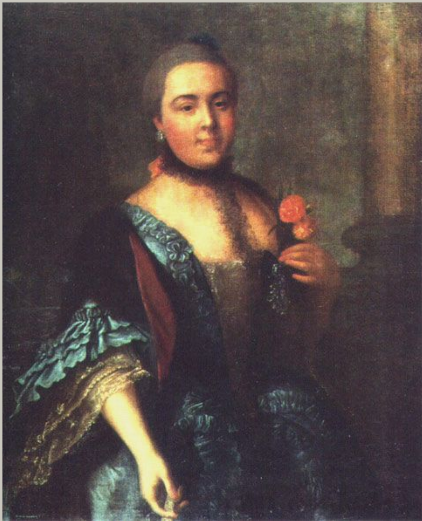
Портрет Е.Л. Воронцовой. 1762. ГИМ Холст, масло. 55 x 40 Государственный Исторический музей,

Петр III хотел любым возможным способом освободиться от жены, будущей императрицы Екатерины II, и осуществить давнее свое желание — жениться на фаворитке, Елизавете Романовне Воронцовой. По отзывам близких к Петру лиц, она «ругалась, как солдат, косила, дурно пахла и плевалась при разговоре». Рябая, толстая, с непомерным бюстом, она была как раз тем типом женищины, который нравился Петру Федоровичу, во время попок громогласно называвшему свою подружку не иначе как «Романова».