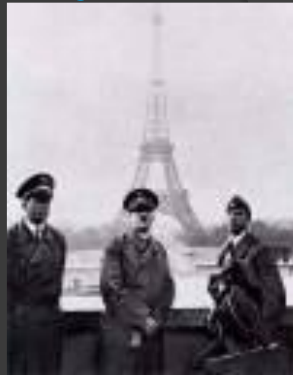
А.Гитлер с соратниками в Париже 1940 год