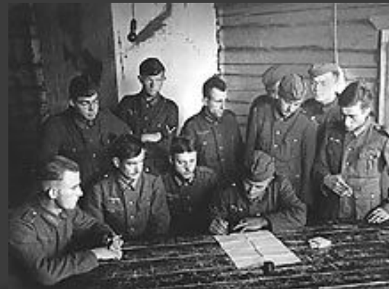
Немецкие солдаты на Западном фронте. Осень 1939 года.

Англо-французские и сосредоточенные против них германские войска бездействовали. Правительства Великобритании и Франции рассчитывали на примирение с Германией, а немецкая армия готовилась к наступлению против стран Зап. Европы.