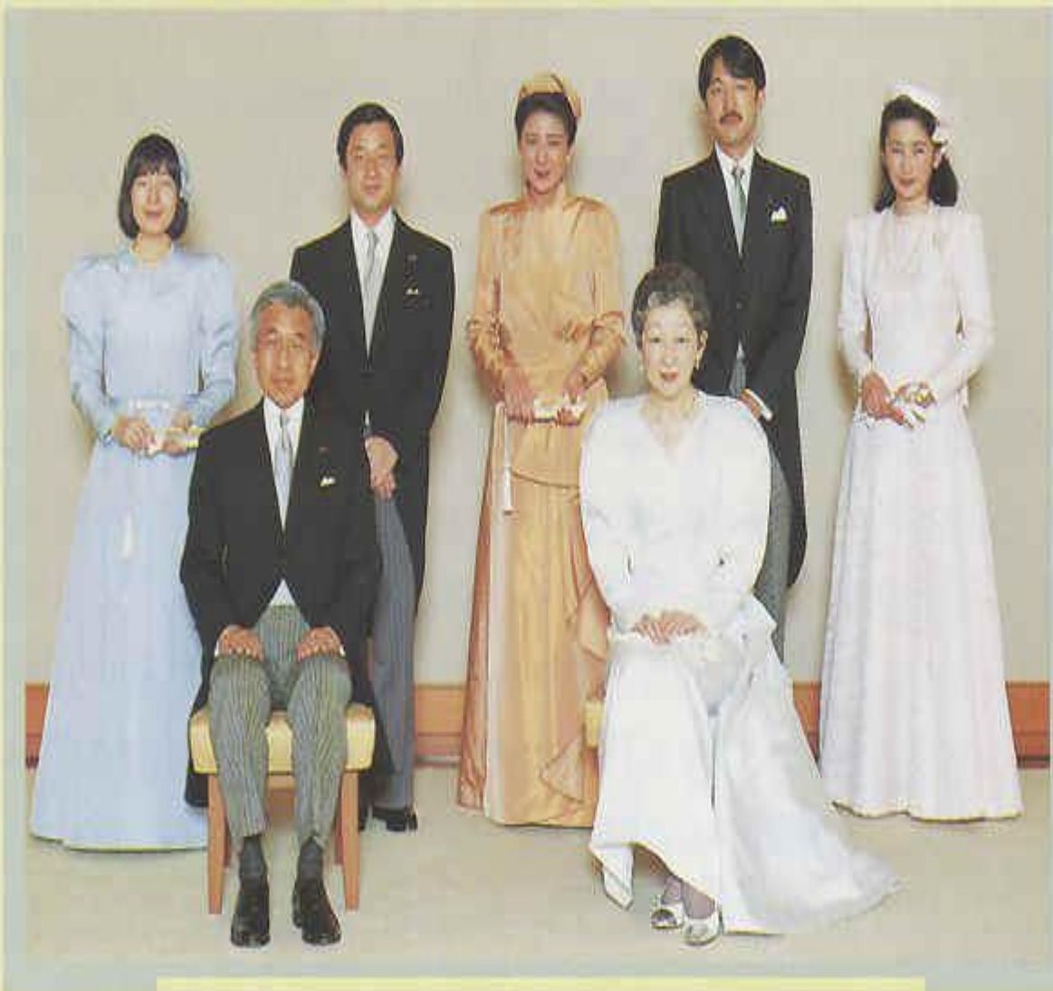
Императорская семья: в первом ряду сидят Император Акихито и Императрица Мичико. Сзади слева направо стоят Принцесса Саяко, наследный Принц Нарухито, Кронпринцесса Масако, Принц Акисино и Принцесса Акисино.